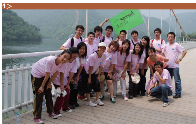
图7> 疯狂者队团队展示