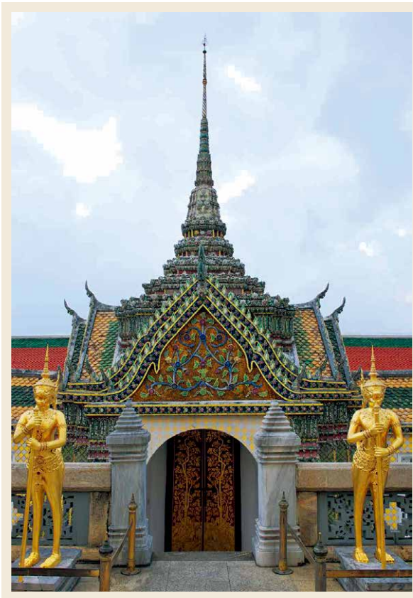
第209页 曼谷内殿式样。 第210页 曼谷内殿。 第211页 曼谷内殿。 第212页 (上) 曼谷上的佛教艺术。 第213页 (下) 曼谷内殿。这里供奉有神像的雕像。又有马的雕像和尾巴。