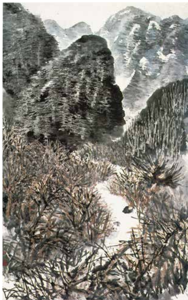
石鲁《秦岭山麓》宣纸 1961年