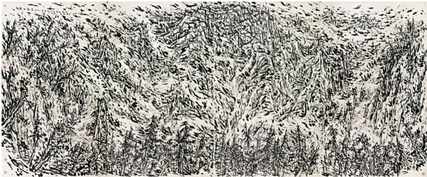
崔振宽 《秦岭大壑》 纸本焦墨 258.5×620cm 2014年

雕塑上，陕西雕塑院和西安美院雕塑系以张琨院长和王志刚主任为代表，在雕塑创作上一直在做不懈努力，他们以汉唐石刻、壁画雕塑为学习基础，不断开启着雕塑的新形态。