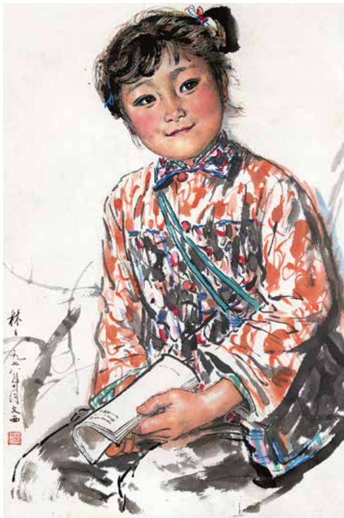
刘文西 《林林》 68X46cm