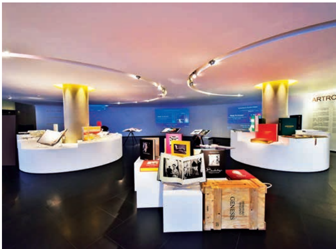
摄影艺术图书策划