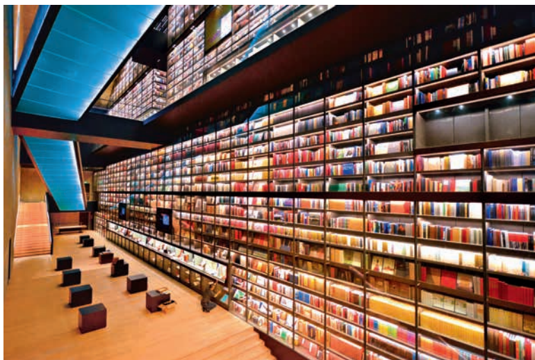
摄影图书推广销售

以及艺术图书展示销售区、多媒体体验区和贵宾体验区，让艺术文化爱好者感受身临其境的艺术冲击，不仅为摄影艺术家提供多样化的图书需求，同时也为摄影艺术家的实体作品销售打造高精准的销售平台。