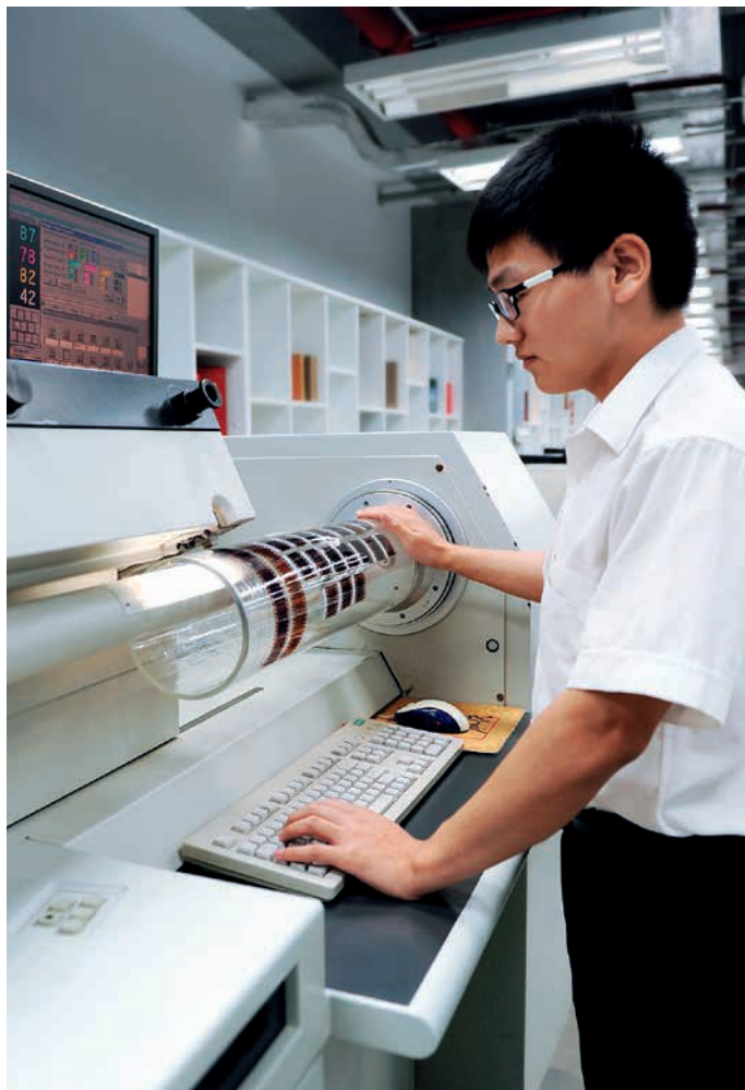
影像艺术数字资产管理

影像艺术数字资产管理包括胶片保管、数据编辑及数据管理，是雅昌为摄影艺术家提供艺术成果的存储、应用的数字化解决方案。雅昌拥有专业的胶片存储设备，恒温恒湿，以及完善的流转、交接流程，并建立突发事件应急处理机制。在数据管理方面，搭建科学的数据采集、编辑、管理平台，依据全面、完善的艺术数据组织标准，由专业的艺术数据编辑团队进行统一管理，形成艺术家个人数据库。雅昌同时拥有亚洲最大的艺术数据 IDC，建有北京、深圳、上海三地 IDC 中心，实现三地数据容灾镜像备份，最大限度保证数据安全，满足用户云端就近访问，最终实现个人摄影艺术资产的保护和应用的高度统一。