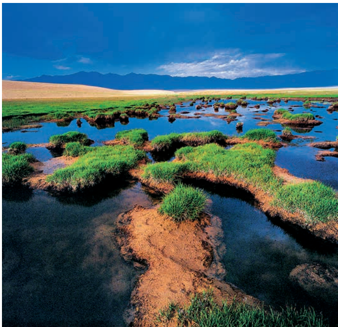
摄影图书印刷_雅奕