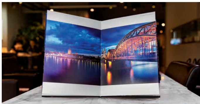
摄影艺术品开发及销售

“传给雅昌”是一个专业的艺术影像在线服务平台，是为专业摄影师及摄影爱好者的个人影像作品，提供集数字个展、调图设计、个性输出、作品购买/销售于一体的在线服务平台，研发制作专业级艺术画册、艺术框画等实物产品。