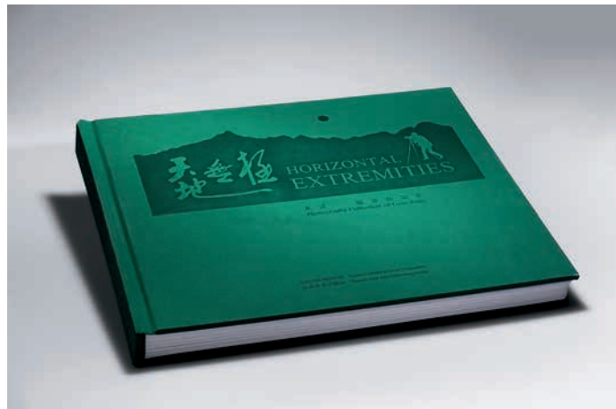
《天地无极》：2013年，美国印制大奖 - 班尼金奖

这本画册从书籍外壳到内文制作，都可圈可点。其封面用意大利变色皮，热压变色；内文选用雅奕印刷技术，高精度加广色域的印制后过光油，真实再现风景原貌。