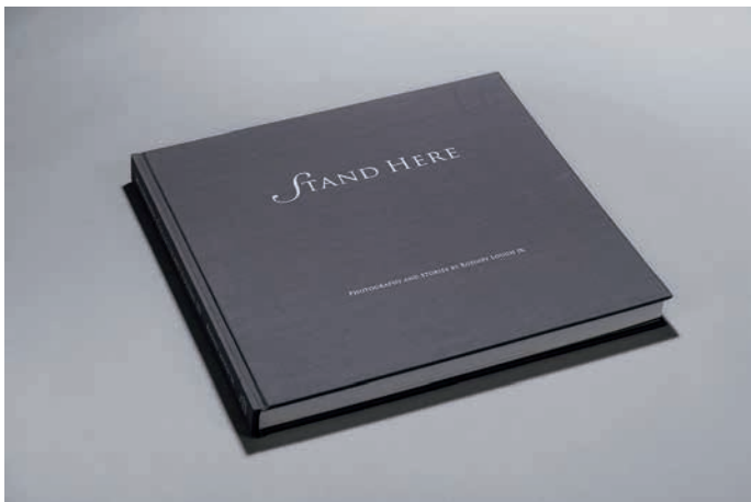
《在这里》：2013 年，美国印制大奖 - 班尼金奖

作品内页采用雅奕技术印刷，印色艳丽，色域宽广，颜色饱和堪比原作，完美还原风光神韵，画册装帧设计为方脊精装搭配护套装帧，凸显美感。