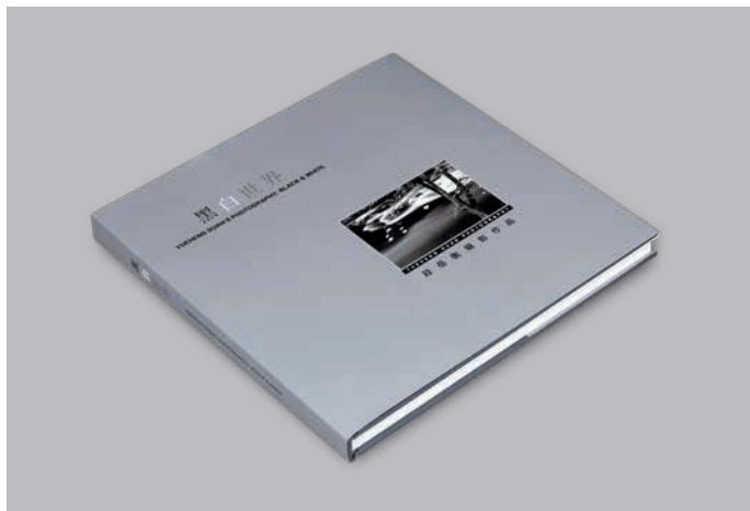
《黑白世界》：2011年，美国印制大奖 - 班尼金奖