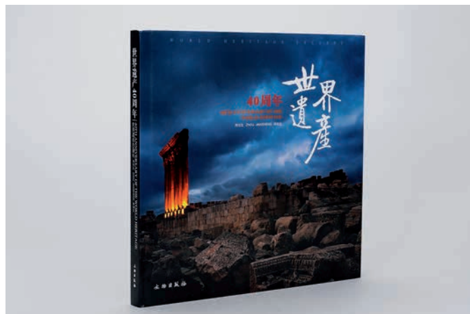
《世界遗产40周年》：2013年，美国印制大奖 - 班尼金奖

在《世界遗产40周年》这本书中，每幅作品都记忆着生命的轨迹，每座遗址都诉说着曾经的辉煌，它们跨越了语言和时空，凸现了世界文明发展的悠远与坚韧。画册方正大气，封面单面光胶，局部磨砂UV，内文采用雅奕印刷4色加高光亮油，让整个图片无论是色彩还是层次方面都达到了至臻至美的意境，完美再现世界遗产的壮美风光。