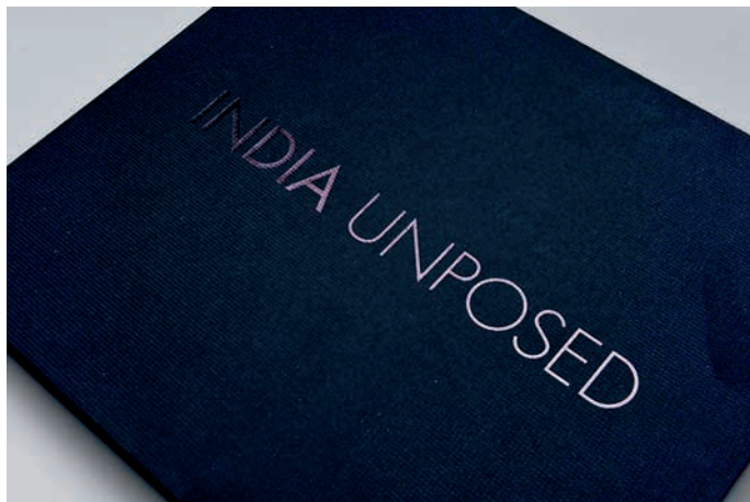
《印度街拍》：2015年，美国印制大奖 - 班尼金奖

《印度街拍》是摄影师 Graig Semetko 受邀参与莱卡 100 周年展览而拍摄的作品。2013 年夏天，Semetko 带着一部 Leica Monochrom 和 M240 走遍了印度。一步一影，用脚步丈量时光，用镜头定格视野，最终于书中呈现的各种景象给人时光交错的幻觉。这本书的装帧、选材用料极为讲究，书盒是两边对开的设计，读者翻开书籍，就仿佛开启了时光之门。烫有亮黑的布面书盒和书壳，黑色的飘有灰白色的絮的环衬，仿若依然熠熠发光的旧时光——这就是现代的印度，一个丰富的印度。内页采用雅昌独有雅映四色黑白印刷，完美呈现摄影师眼中具有永恒生命力的黑白景象。