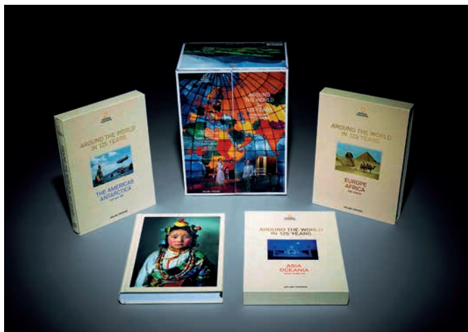
《国家地理》：2015年，美国印制大奖 - 班尼金奖

《国家地理》由鲁伊夫·戈尔登亲自操刀，3卷书，横跨6大洲，绵延125年，1404页图片，每一张图片都是一个陌生而又惊心动魄的故事，它们见证了从黑白照片到彩色摄影的转变，记录了从柯达胶卷时代到数码时代的进步，演绎浪漫唯美的自然风貌到真实严峻的人文纪实；这些从历史长河走出来的图片，已然超出图片本身的意义，它们是国家地理成长的最美标志，是世界局势变化最直击人心的证据。这套画册每卷有三个文版，韩文、繁体中文和简体中文，分第1、2、3卷系列。圆脊精装书加书匣封套瓦楞盒独立套装，工艺技术极为考究。每卷精装面纸烫金压凹，配置可对口折叠书匣，可轻松转换成精美的书架，展示书籍百年旅程提炼的影像散文。各卷的内文环衬，印色各异。雅昌独有雅映、雅奕技术，完美呈现了世界地理的原貌。