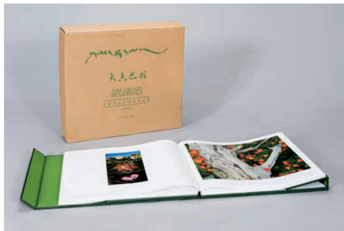
《大香巴拉》：2011年，美国印制大奖 - 全场大奖、班尼金奖

本书采用方脊精装书配瓦楞书盒，精装皮壳分内外皮壳，内皮壳面纸用绿色意大利皮革裱灰板，热压凹变色，使书籍外形精美高档。书成型后内皮壳封三裱在精装外皮壳的封三处成型，外皮壳用绿色意大利皮革裱荷兰板，烫哑金且压凹，热压变色，接口处配两对高磁力条形磁铁，搭扣成品后贴合紧密，画册采用雅昌独有的雅奕技术，大香巴拉的神韵，一览无余。