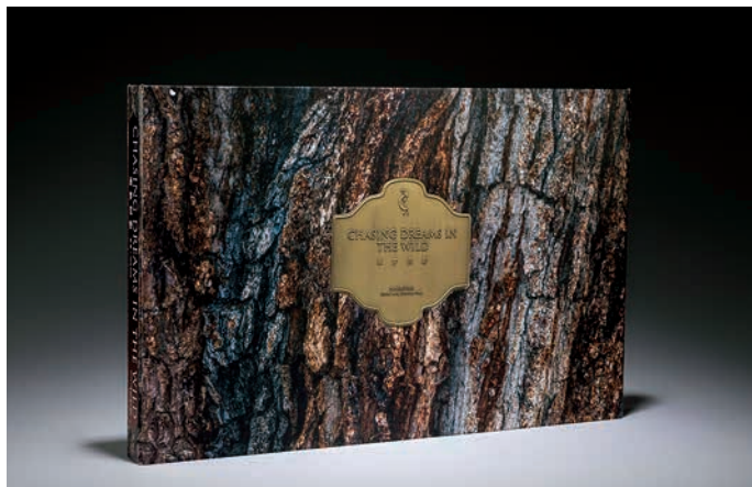
《逐梦荒野》：2015年，美国印制大奖 - 班尼金奖

为了再现西部的粗犷，封面特地选用真牛皮，配有美国西部树干化石图案的书盒，美国西部的风情正待开启。封面采用激光烧字工艺，将文字、西部岩石、印第安画像一并烫印于牛皮之上，书籍切口采用最新的毛边工艺，并配以牛筋、铜板等元素，美国西部的原始风情便流连指尖；内文采用雅昌独创的雅奕技术，真实还原每一幅作品的绚丽色彩。