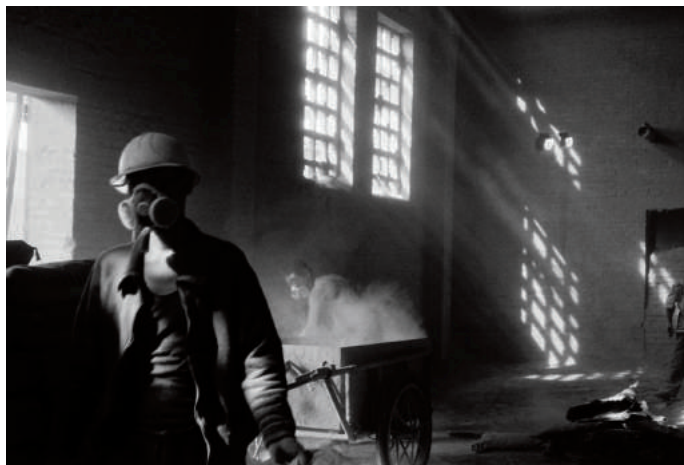
粉尘中的工作者系列——水泥生产旺季，只有日出而作，没有日落而归