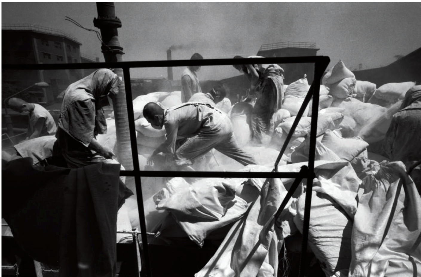
粉尘中的工作者系列——在暴晒中与粉尘打交道的劳作者