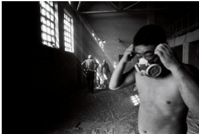
粉尘中的工作者系列——即便戴上面罩，也无法阻止矽肺病的侵袭

林永惠的镜头，似乎对准的都是最普通的人：农民、矿工、流浪儿童、火车旅客、失业者……他的作品呈现出苦难，也呈现出人性最真实的一面，他以摄影这种温柔的方式，用最佳的构图和最美的光线，抚摸着那些在困境中蠕动挣扎的人们，并不为同情或怜悯，而是为了展现最强大的忍耐力和不可蹂躏的尊严。