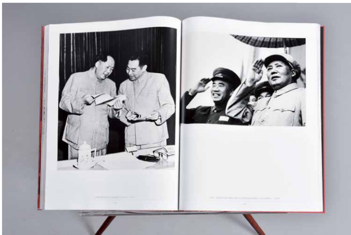
上图左侧：毛泽东与周恩来在中央人民政府第24次会议上

他俯身向前，兴致勃勃地和少先队员一起观赏校园活动照片，表情也如孩童般欢欣；他试戴少数民族