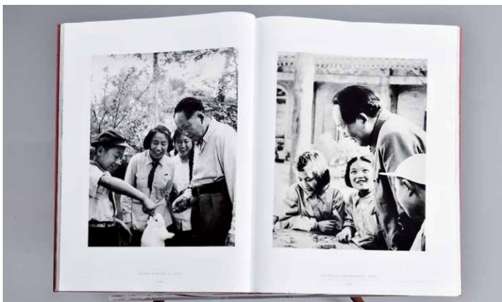
上图右侧：毛泽东和少先队员一起观赏校园活动照片