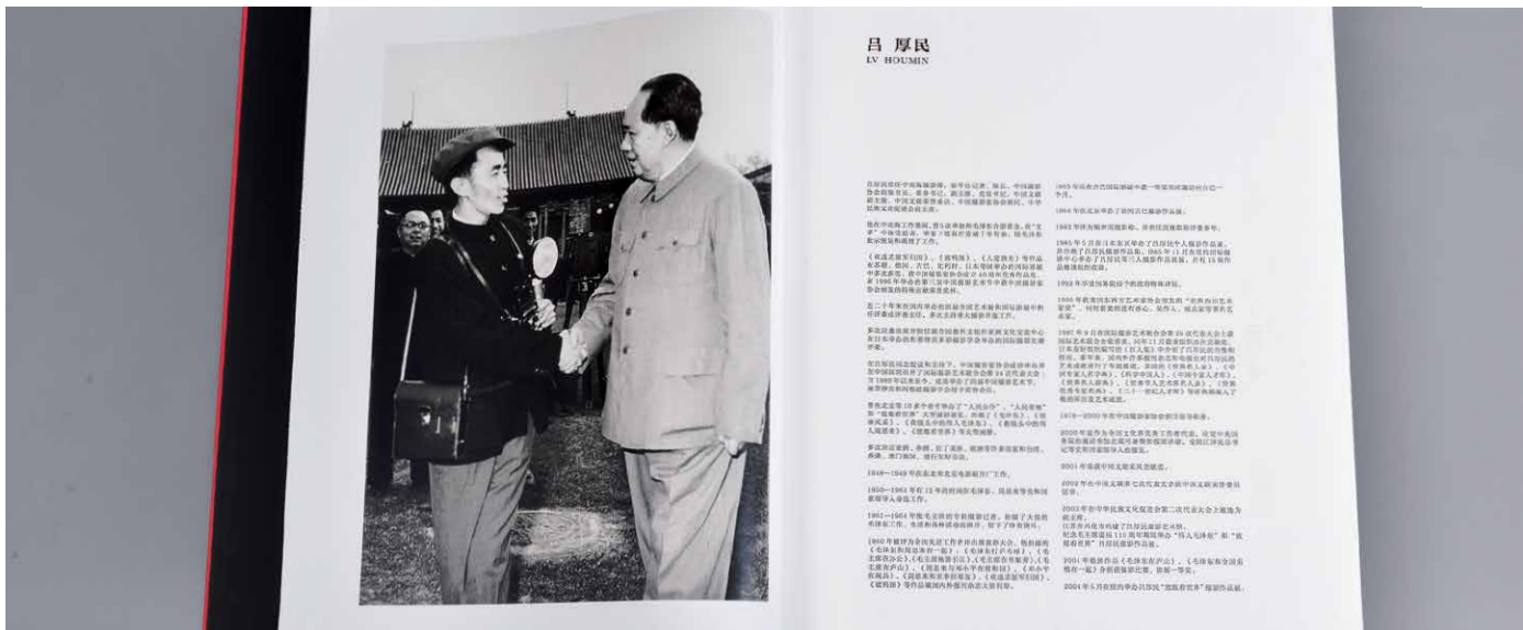
上图左侧：吕厚民与毛泽东的珍贵合影

吕厚民曾为自己的影展写下这样的文字：“不但要时刻注视常常容易被忽略的重要瞬间，还要努力捕捉转瞬即逝的美好瞬间。摄影是瞬间的艺术，明天的历史。不要忽略重要的瞬间，就要有好眼力，即较高的认识能力。不要错过转瞬即逝的美好瞬间，还要有较高的技艺和较强的应变能力，这是认识能力和操作能力的高度统一。”敏锐、深度，这正是吕厚民一生摄影经验的总结。