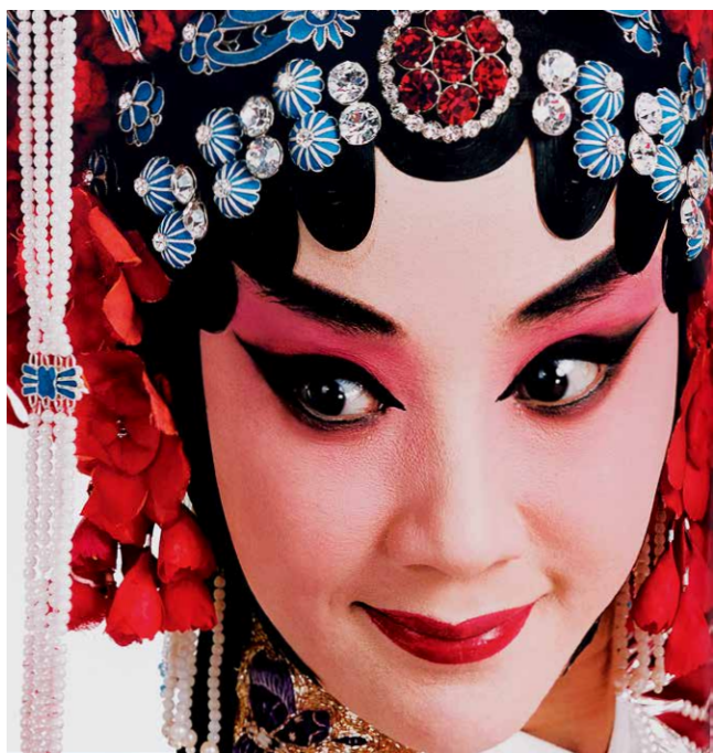
对人物双眸的精微表现