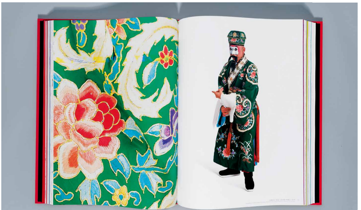
难得一见的老戏装