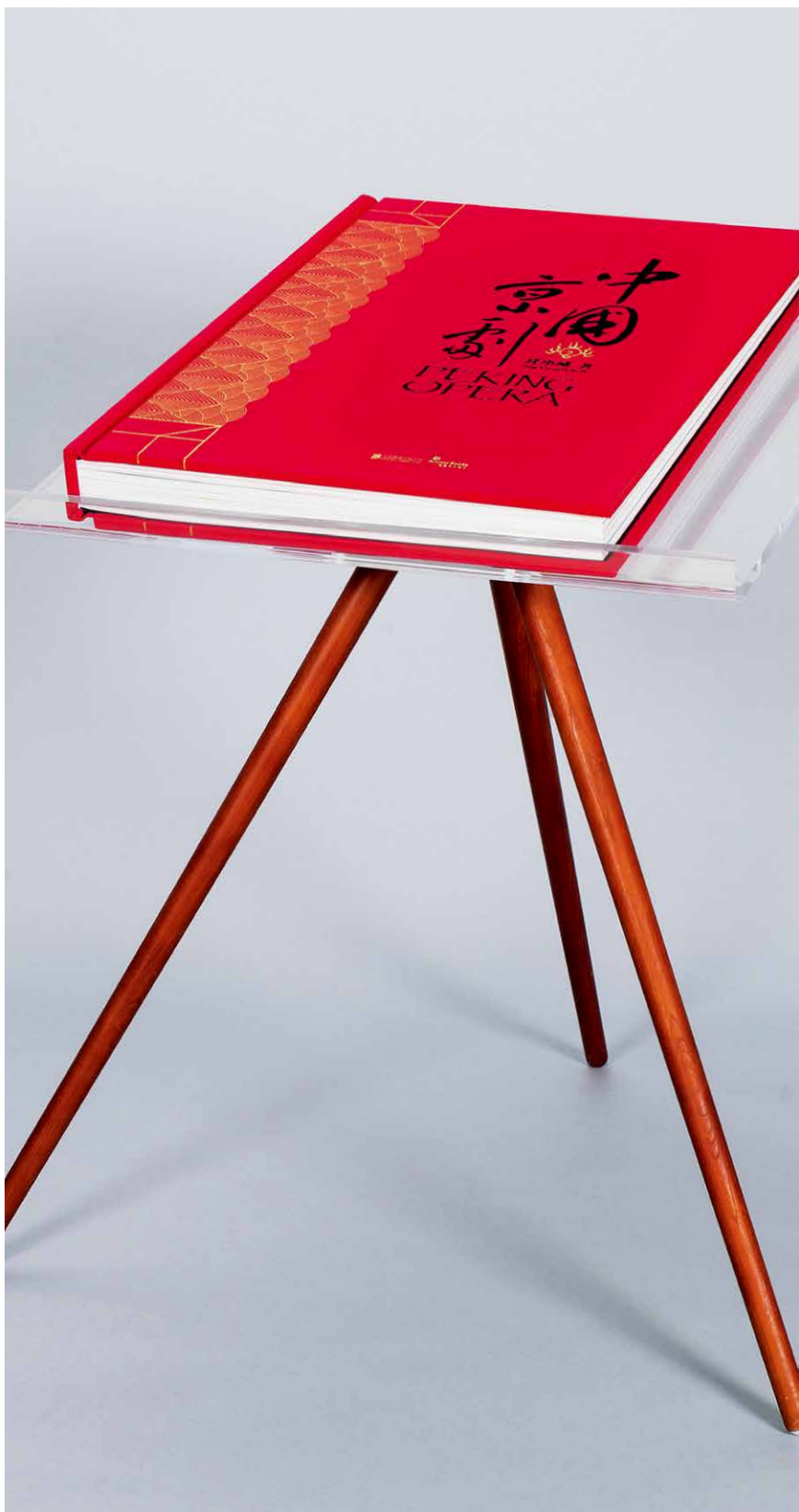
印装考究、极致震撼的定制大书