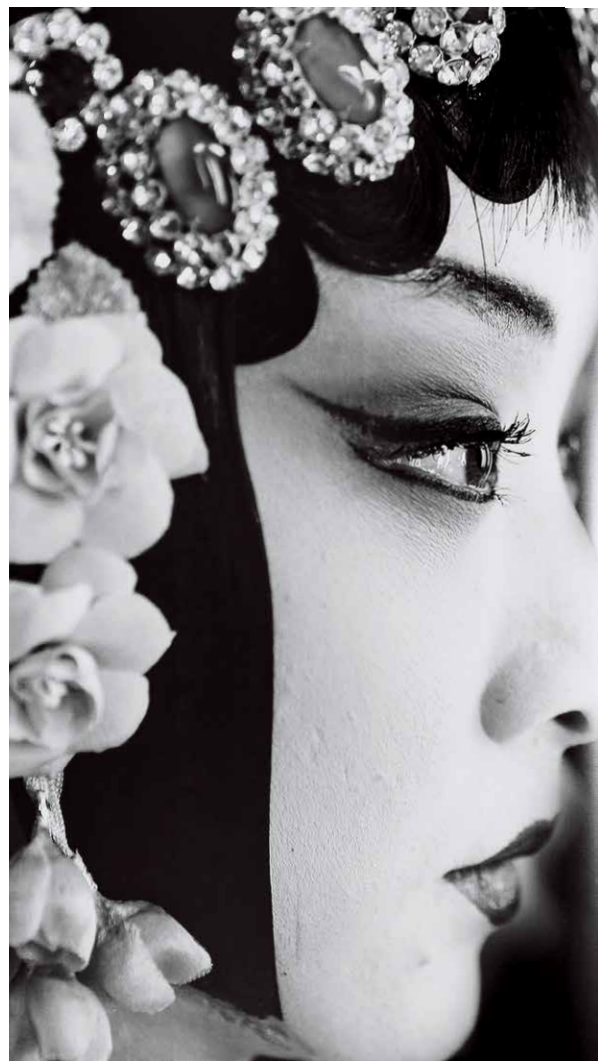
胶片拍摄所特有的颗粒质感