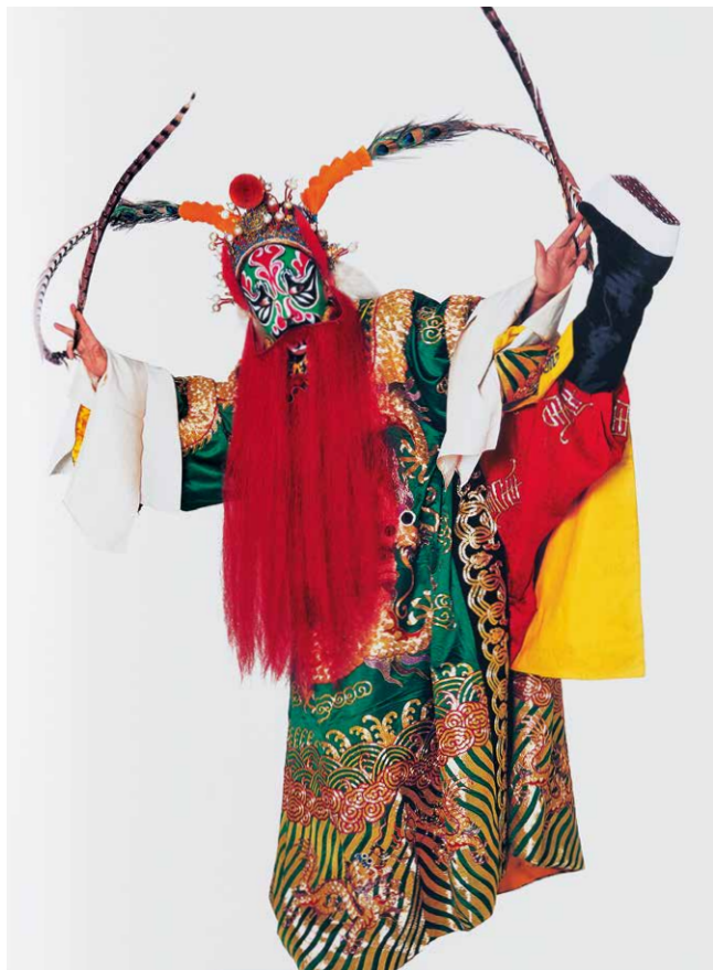
一站就是两三个小时，十分辛苦

在这之前，逢小威做过更著名的事情是，拍摄了1001位中国影视明星的素颜照，以及中国所有奥运冠军的肖像照，胶片特有的层次、影调和颗粒质感，在逢小威人物摄影作品中体现得淋漓尽致。而胶片在细节之处的表现力，无疑与京剧细枝末节中的精巧玄妙相得益彰。