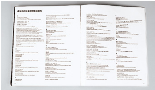
新增“作品名称汉英对照表及索引”，方便检索

今年6月，雅昌推出中文版《teamLab2001-2016》，作品集收录 teamLab 2001-2016 年创作的 106 件数字艺术作品，其中 16 件作品（24 幅图片）在英文版基础上首次新增出版，分章探讨了包括数字艺术、人际关系、超主观空间和数字艺术、身临其境、数字自然和数字城市、协同创作等主题。