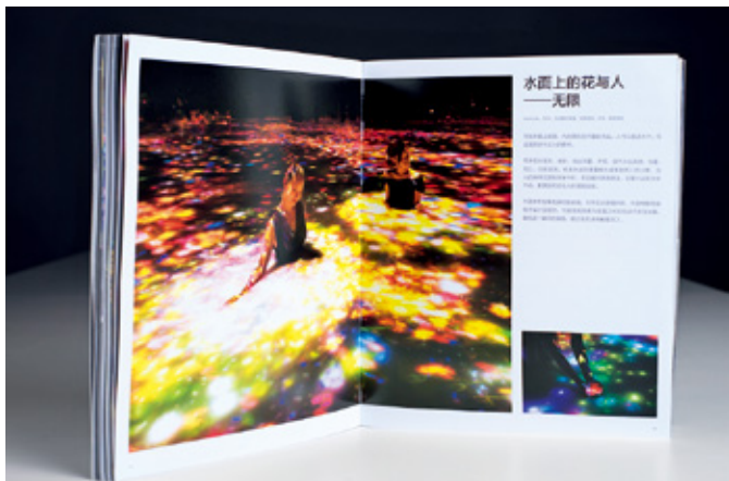
本书译文经译者、编辑严格审核，得到 teamLab 官方确认

谁说离开北上广又不懂 English 的你，就不能满满文艺范儿？雅昌奉上的这本作品集，让你随时随地沉浸在 teamlab 的梦幻森林与光影幻境中无法自拔！229 张精美图片、高品质印刷装帧，还原作品精髓！究竟 what is teamLab？让我们从书中回顾一些展览中的精彩画面吧。