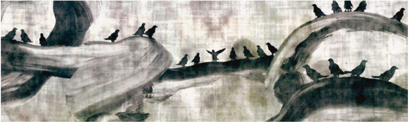
《被追逐的八咫乌 - 白中有黑》

八咫乌，一种存在于东方神话中的三脚乌鸦，代表着太阳和天意。水墨刻画的八咫乌在空中飞翔，水墨尾巴形成了“空间书法”。作品探索了亚洲人的空间认知，存在于超主观空间中的三维空间里。光线之下的八咫乌在空中飞翔，身后明亮的尾巴形成了“空间书法”。作品向板野马戏技法表达了敬意。