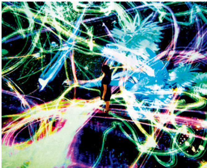
《被追逐的八咫鸟 - 超越空间》

作品通过先进数字技术实现超主观空间中，观赏者与艺术品的互动关系——观赏者成为作品的一部分，打破观赏者和艺术作品的界限。让你在观展之外深入了解数字艺术扩展出的艺术版图和 teamLab 在数字光影背后的终极思考。