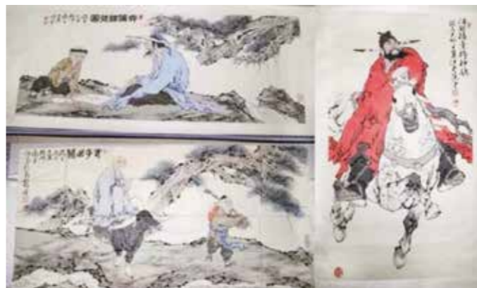
警方查扣的仿制范曾字画（遵义警方供图）