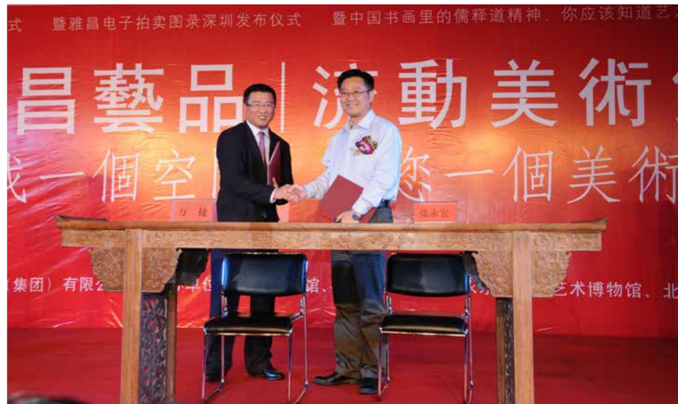
流动美术馆进北京大学深圳研究生院签约仪式

当代视觉方式发生了前所未有的变化，“读图时代”造成图像极度泛滥，学生视觉认知因为频繁“冲击”而麻痹与迟钝；艺术的多元格局也造成审美标准的模糊，学生的艺术感悟因为混乱而不知所措。由此，