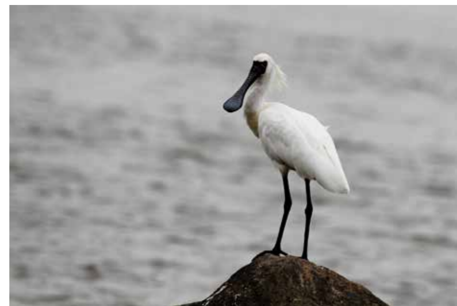
深圳红树林内珍贵的候鸟——黑脸琵鹭

万捷委员表示，为了永远的绿水青山，不管是降污减排，还是对特定生态系统的保护，全面具体的政策支持和相关企业的积极守法，都必不可少。坚持做好这两方面的工作，我们的生态环境将得到更大改善。