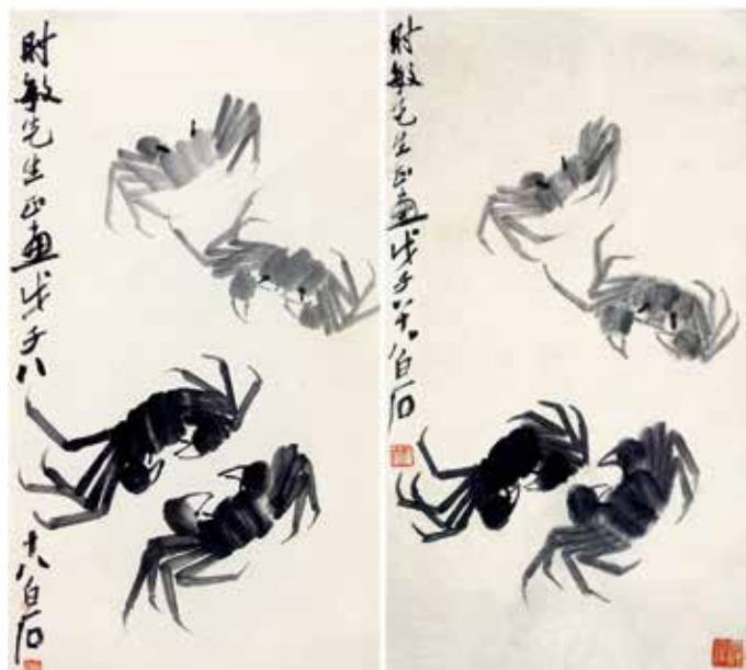
左：蟹（伪作）右：齐白石·蟹·收录于《齐白石画集》