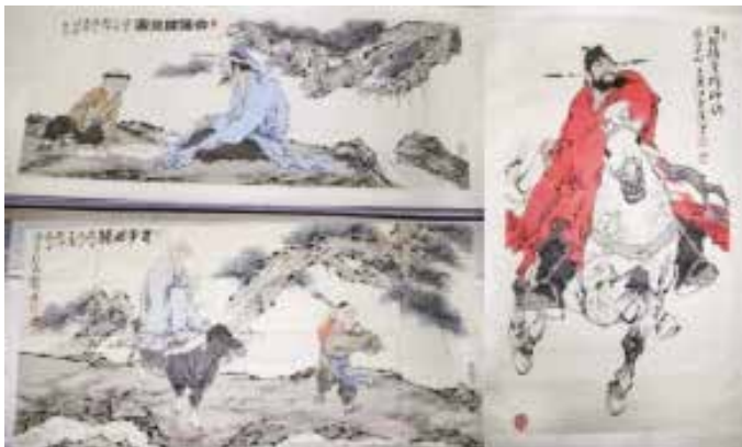
警方查扣的仿制范曾字画