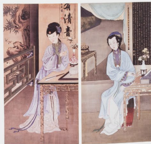
《雍正十二美人图》其一

以后写了一本书叫《金瓶退食笔记》。在这本书里写了很多关于当时在宫里的一些回忆。他记载了南花园种植花卉的情况，以及每个月向宫里进贡什么样的花。这个资料我觉得非常的重要。从这条文字的资料里我们可以知道，南花园相当于现在北京的南三环一带，当时有好多农户种植花卉，来满足社会上的需求。在明代的时候，紫竹附近已经是非常大的花卉种植基地，南花园是供应宫里一年四季的鲜花和插花所需的花材。