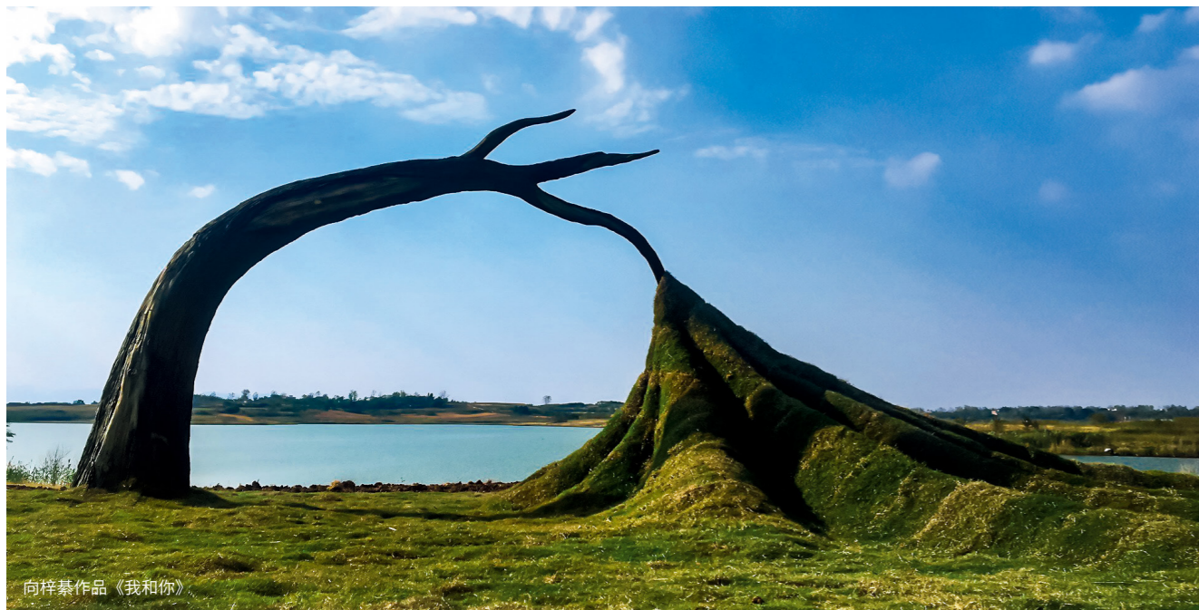
向梓霖作品《我和你》

刘泽芳作品《出离》：由99只蓝色透明材质制作的蝴蝶，组成了这件作品，整个作品呈波浪形有秩序地从东南方向冲向西北方向。风起，蝴蝶翅膀颤动，阳光照射，蝴蝶翅膀闪烁，它会触动人内心深处最柔软的情结。留下易逝的情感，定格住美好的瞬间，同时，它又带着这份美好，走向更远的远方。这个作品最终想要表达对“逝去”与“留存”的恍惚和抉择。