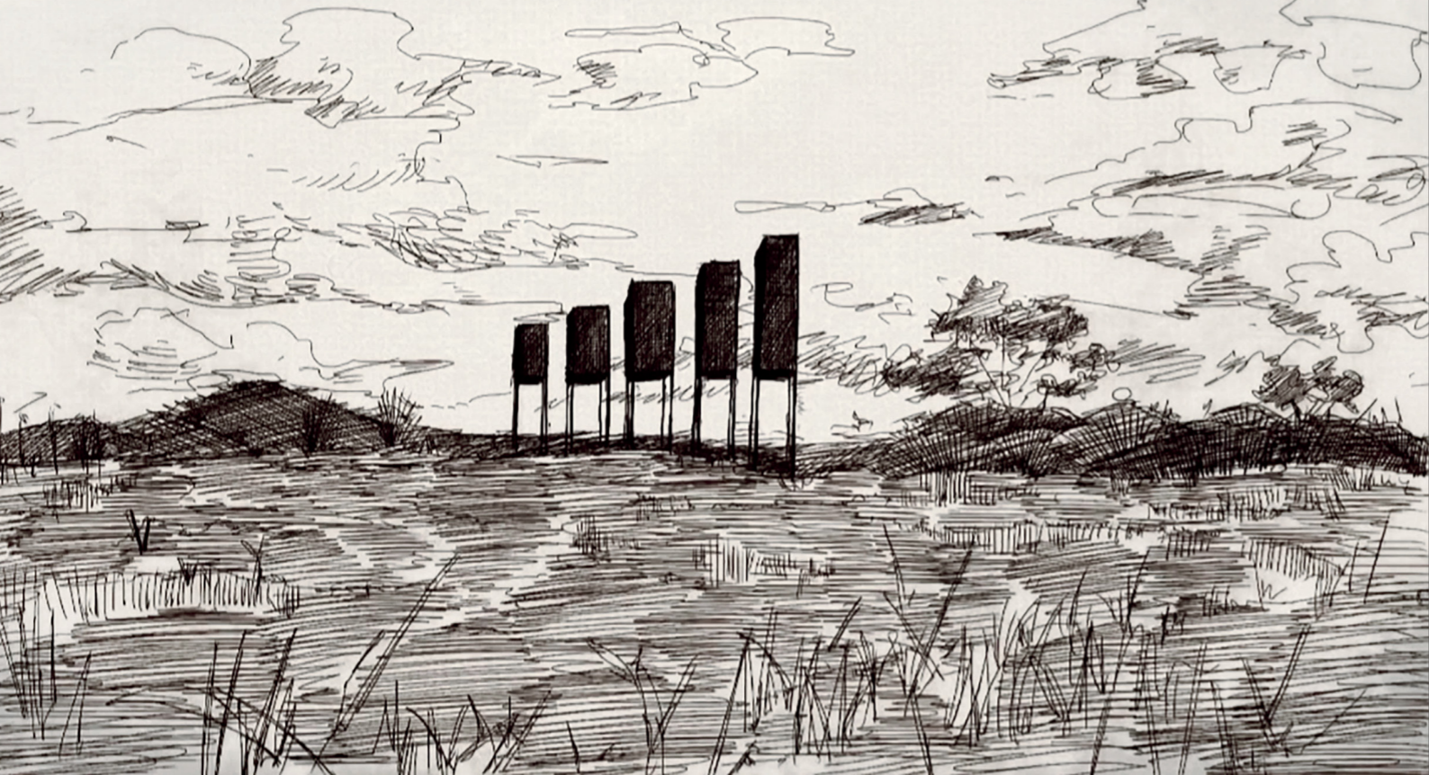
马晟哲的作品《信号》手稿