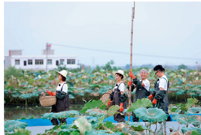
大地艺术家们和村民潜心学习挖藕的技巧