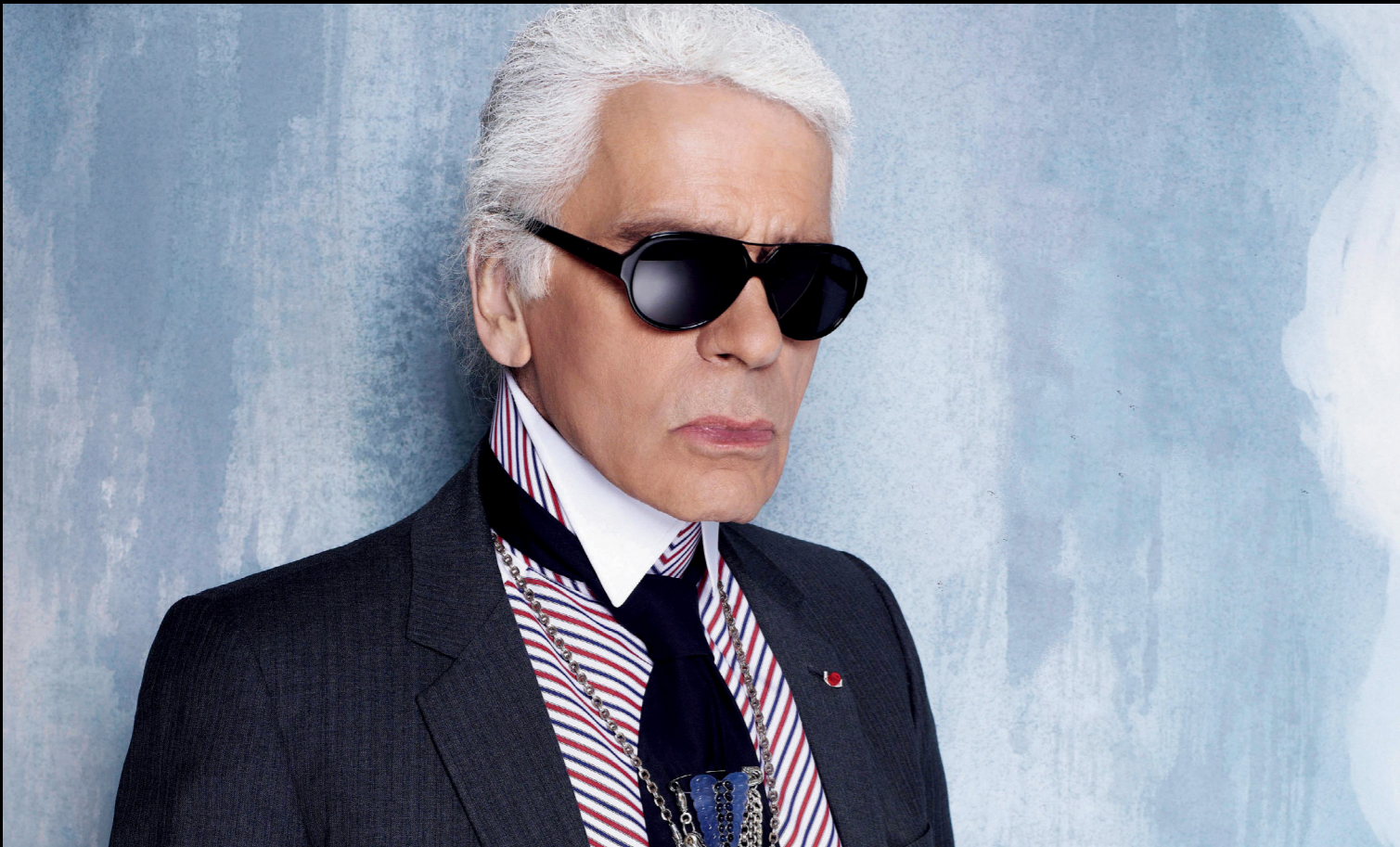
Chanel 前任设计总监 Karl Lagerfeld

还将长发与繁缛华服视为女性标志的年代，香奈儿早早就剪了一头短发，穿着裤子参加社交活动。她以简洁轻便的衣裙呈现女人自由、舒展的体态，受到上流社会的热烈追捧。