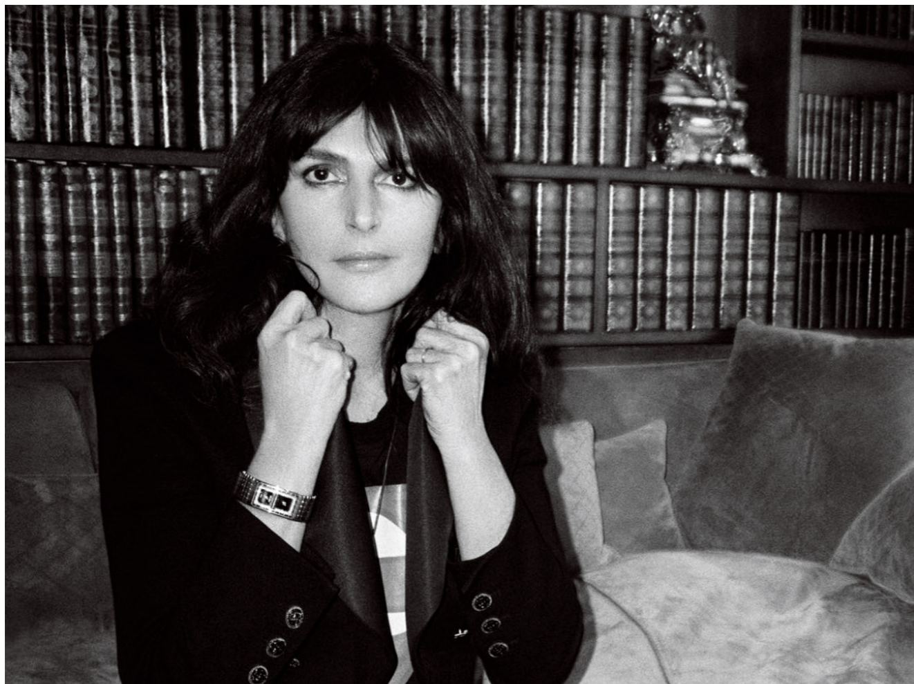
Chanel 现任设计总监 Virginie Viard

2019 高定秀，未曾想竟是永别。巴顿将军有句名言：“一个军人最好的归宿，就是在最后一场战斗中，被最后一颗子弹打死。”这是对事业有极限追求的人才会说的话，Karl Lagerfeld 差一点就做到了。