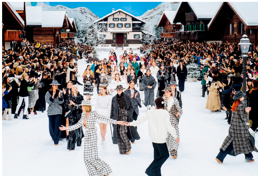
Karl Lagerfeld 的最后一场 Chanel 2019 秋冬大秀，众人缅怀两周前离去的 Karl