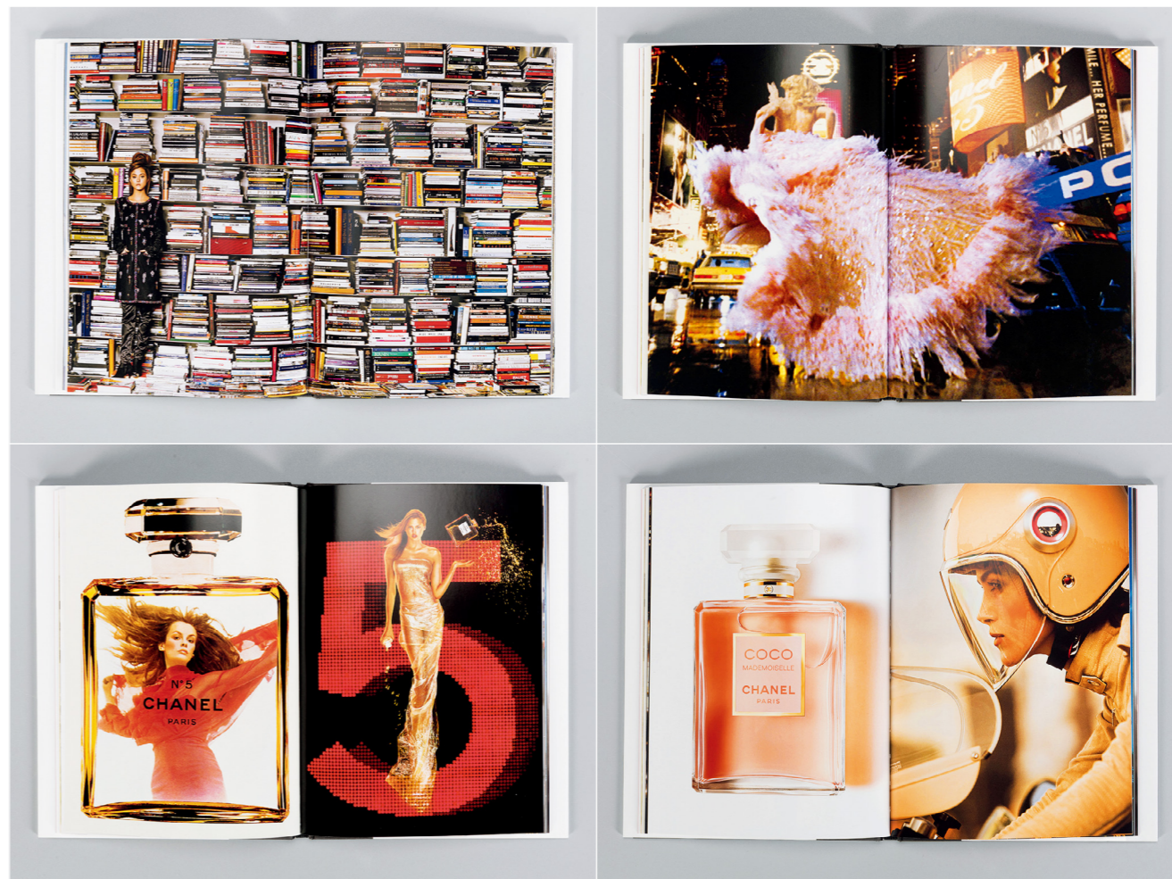
雅昌为 Chanel 印制的产品手册

相比 Chanel 前两位奉行独身主义、性格鲜明的设计师，维吉妮本人则低调得多，她曾说自己厌恶被曝光，因此几乎不上镜也很少接受采访。工作之外她很享受家庭生活，包括看十几岁的儿子写作业，和制作音乐的丈夫去听歌剧。她的穿衣风格比较舒展休闲，看得出她并不追求骨感的纤细美，身材有点发福；总是一身黑或灰色，穿宽松的阔腿裤或牛仔裤。相比卡尔在 67 岁时