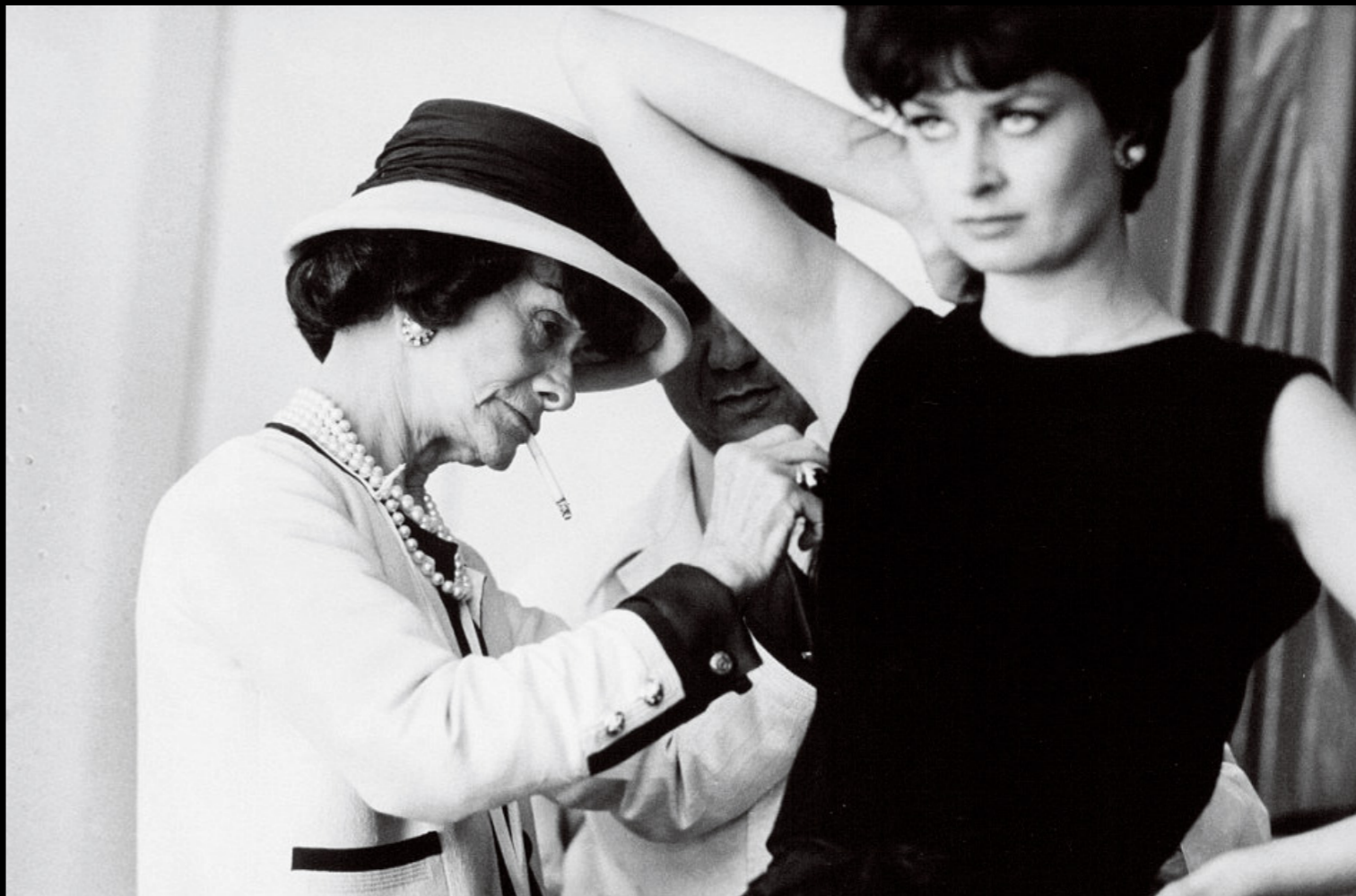
Chanel 创始人 Gabrielle Channel

4月20日，Mademoiselle Privé《走进香奈儿》展览在上海西岸艺术中心举办。众多海内外明星前来捧场，网红、游客纷纷打卡参观，引发了一阵社交媒体上的刷屏热潮。