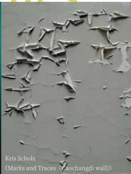
Kris Scholz 《Marks and Traces (Caochangdi wall)》