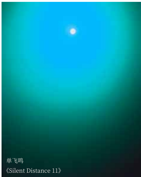
单飞鸣 《Silent Distance 11》