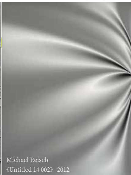
Michael Reisch 《Untitled 14 002》 2012