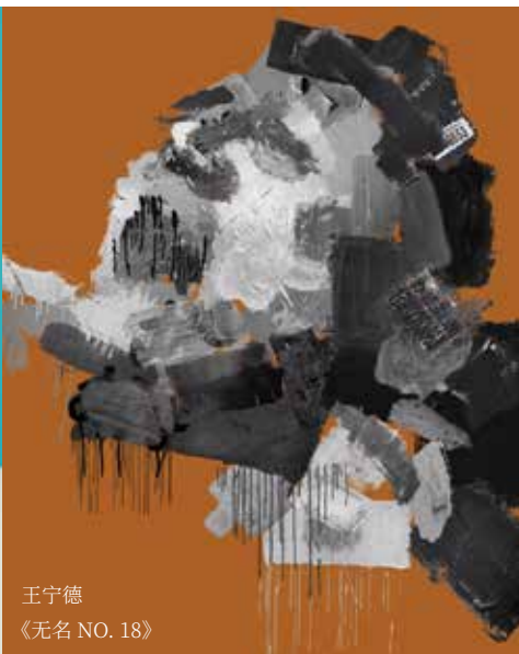
王宁德 《无名 NO. 18》