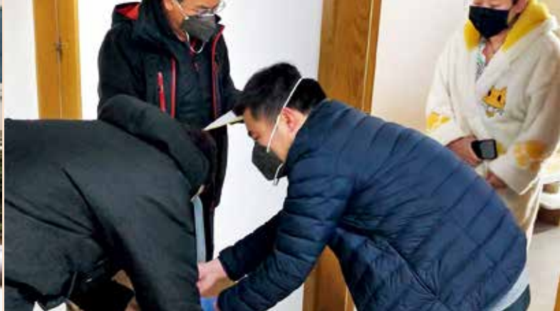
为隔离人员购买各种零食