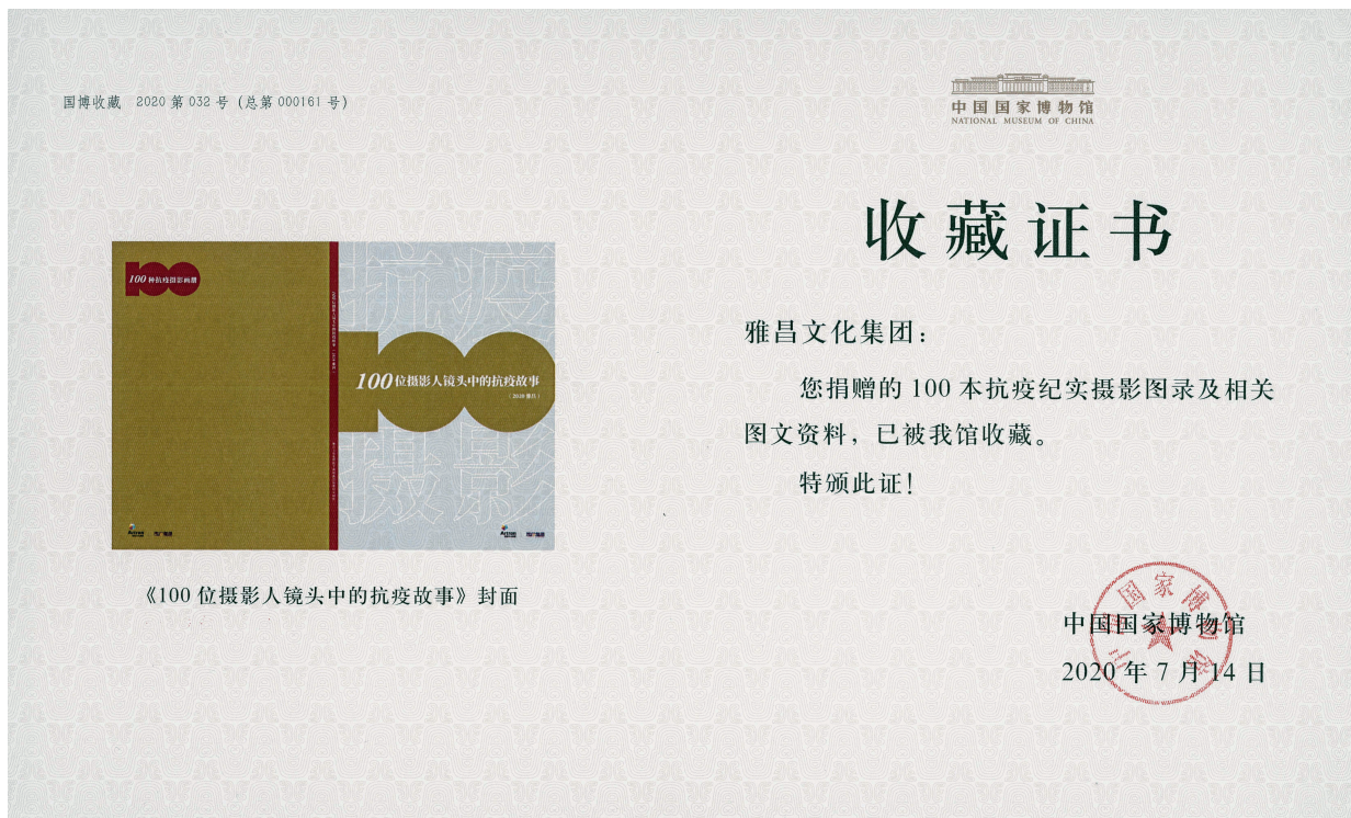
《100 位摄影人镜头中的抗疫故事》封面

2020 年，新冠肺炎来势汹汹肆虐全球，中华民族在这一场战“疫”中再次谱写了民族壮歌。