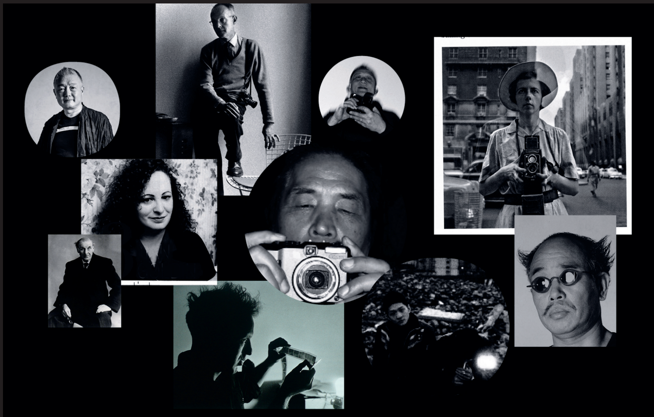
记录城市表情的摄影家们