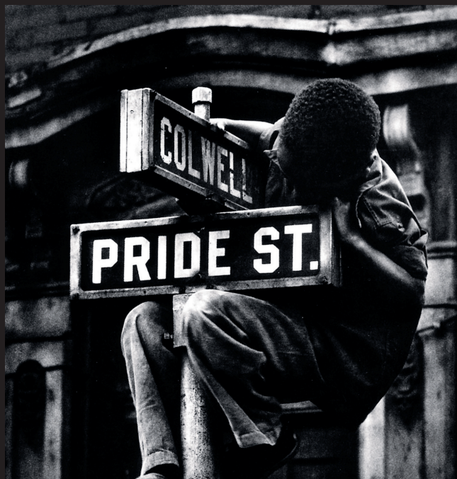
书中作品匹兹堡，普莱德街（1955-56）

这些书中照片的拍摄者们，都是摄影史上极其重要的人物，他们把城市摄影的镜头推向一个又一个的高峰。每一张照片的背后都是一个传奇。而这一张张照片的汇集，更是他们传奇的人生写照。