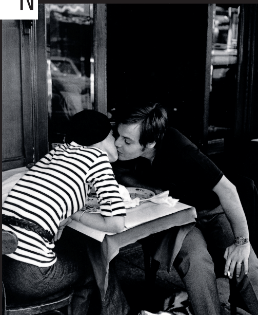
书中作品·巴黎街头的饭店外

而有这样一本书——《城市表情》，记录了30余位摄影师深入都市，观看城市的视角，记录下都市的表情。他们那之中，既有像欧仁·阿杰这样的以纯粹记录都市全部细节为己任的摄影家；也有像奥古斯特·桑德这样的通过为都市中人造像来聚焦都市生活形态的摄影家，既有像克莱因这样的以都市为自己的感情宣泄对象而在与都市的对抗中形成了自己风格的摄影家，也有像荒木经惟这样只把都市看成是一个欲望发生装置而始终在以摄影与之调情的摄影家。