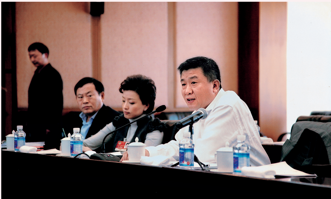
2011年3月全国政协会议上提出的“垃圾分类”议案被列入全国政协和国务院重点督办提案

的内容也详略差异很大；公开的信息中关键要素缺失，投入巨资打造的水环境监测体系所产生的信息绝大部分未向公众公开；信息混杂、检索无效、更新滞后、链接失效、删除往期报告现象十分常见。万捷建议：一是要求派出机构、各级生态环境主管部门限时自查网站水质信息发布情况，依法发布水质监测结果和年度环境状况；二是尽快制定环境质量信息公开清单和水环境质量信息发布细则；三要完善环境质量信息公开问责机制；四要加大对基层生态环境部门信息公开工作的指导和扶持力度。值得欣慰的是，在万捷委员等人的持续数年努力下，企业环境信息公开在不断通过立法一步步法制化和系统化。（《关于督促地方生态环境部门履职发布水环境质量信息的提案》）