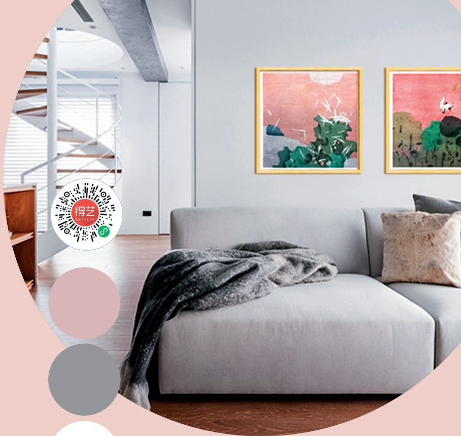
《朝花不夕拾之四》石磊 版画

巨蟹座的人不太喜欢复杂而又跳跃的东西，喜欢安稳，家装配色适合选择简单的白色或者灰色，加一点柔和温暖的粉色会更显温馨。