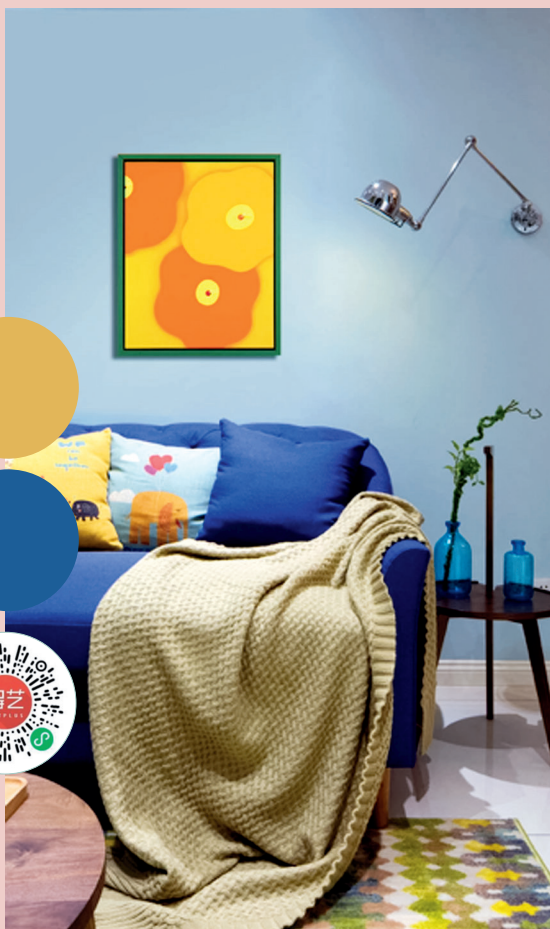
《The gift of love》禹露 限量签名版画

双子座的人喜欢把自己的才智用于事业方面，善于调动自己朋友的积极性。在涉及人际关系方面的工作中，会表现出非凡的才干。灵巧聪明的双子们好奇心旺盛，家装配色适合活泼的橙色和冷静的蓝色，这样会让双子们更加踏实。