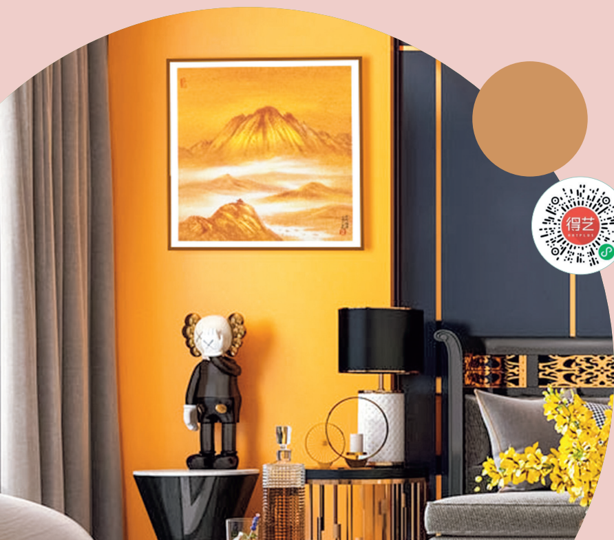
《朝花不夕拾之四》石磊 版画

狮子座的人喜欢把自己的房间装饰得富丽堂皇，希望自己的家就是一个布满艺术品的世界。家装配色适合选择贵气的金色，彰显狮子座的威严、宽厚、仁慈与高傲。