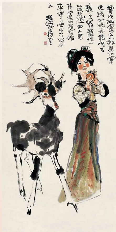
程十发《少女与鹿》纸本设色 136×66cm 1984年深圳美术馆收藏

深圳博雅艺术书店坐落于东门，恐怕是在深圳能找到的最文艺的书店了吧，每次逛东门只要有时间我就会去博雅逛一圈。如果你爱好文艺，喜欢绘画、音乐、摄影、平面设计、国画、国宝、漫画、旅游、数码设计、室内装潢等任何一项，博雅都不啻消磨时光徜徉艺术世界的好去处。上世纪八、九十年代更是辉煌一时，是深圳几乎所有书画家的聚集地，被称为“深圳文化三件宝”之一。博雅40年的起起伏伏，见证了深圳早期文化改革的艰难历程，也承载了許多人关于深圳文化的难忘记忆。