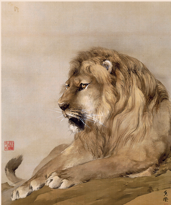
何香凝《狮》设色绢本 63×49cm 1914年 何香凝美术馆藏

艺术深圳以“当代艺术”主题为核心,由中国(深圳)国际文化产业博览交易会组委会办公室主办,深圳报业集团、深圳国际文化产业博览交易会有限公司承办,每年九月在深圳会展中心举办。何香凝美术馆,位于深圳,是中国第一个以个人名字命名的国家级美术馆。这些展馆也在不断的推动深圳艺术会展的蓬勃发展。