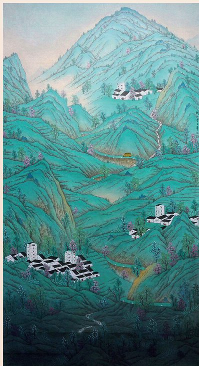
曹金华 岭南新春 纸本设色 173×95cm 2015年 关山月美术馆藏

1993年，19岁的湖南美术工作者曹金华来到深圳，此后成长为中西兼擅的书画名家，有“小悲鸿”之誉，是深圳本土美术发展的一个缩影。