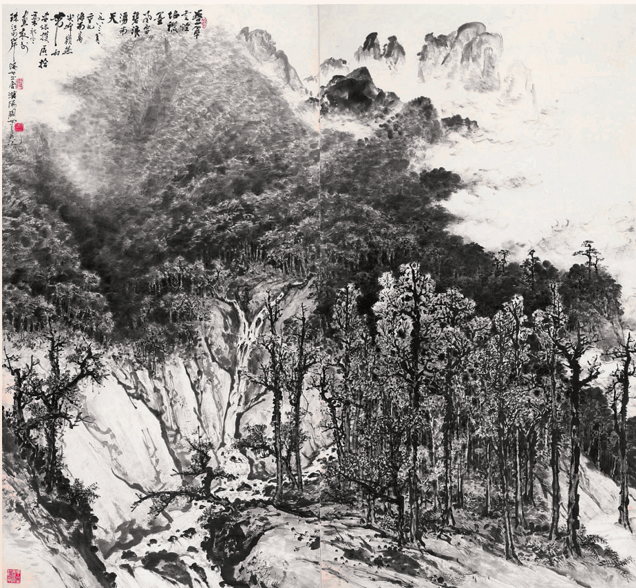
关山月 《碧浪涌南天》 纸本水墨 300×250cm 1994年 关山月美术馆藏

及其所处的 20 世纪中国美术作品为特色，具备国家美术馆的各项功能，1995 年元月奠基，1997 年 6 月 25 日香港回归前夕落成开馆，成为深圳最重要的美术展览场馆。2010 年前美术馆走博雅和书城的多，2010 年前走关山月走的多，意味关山月美术馆的展览越来越活跃和高大上。