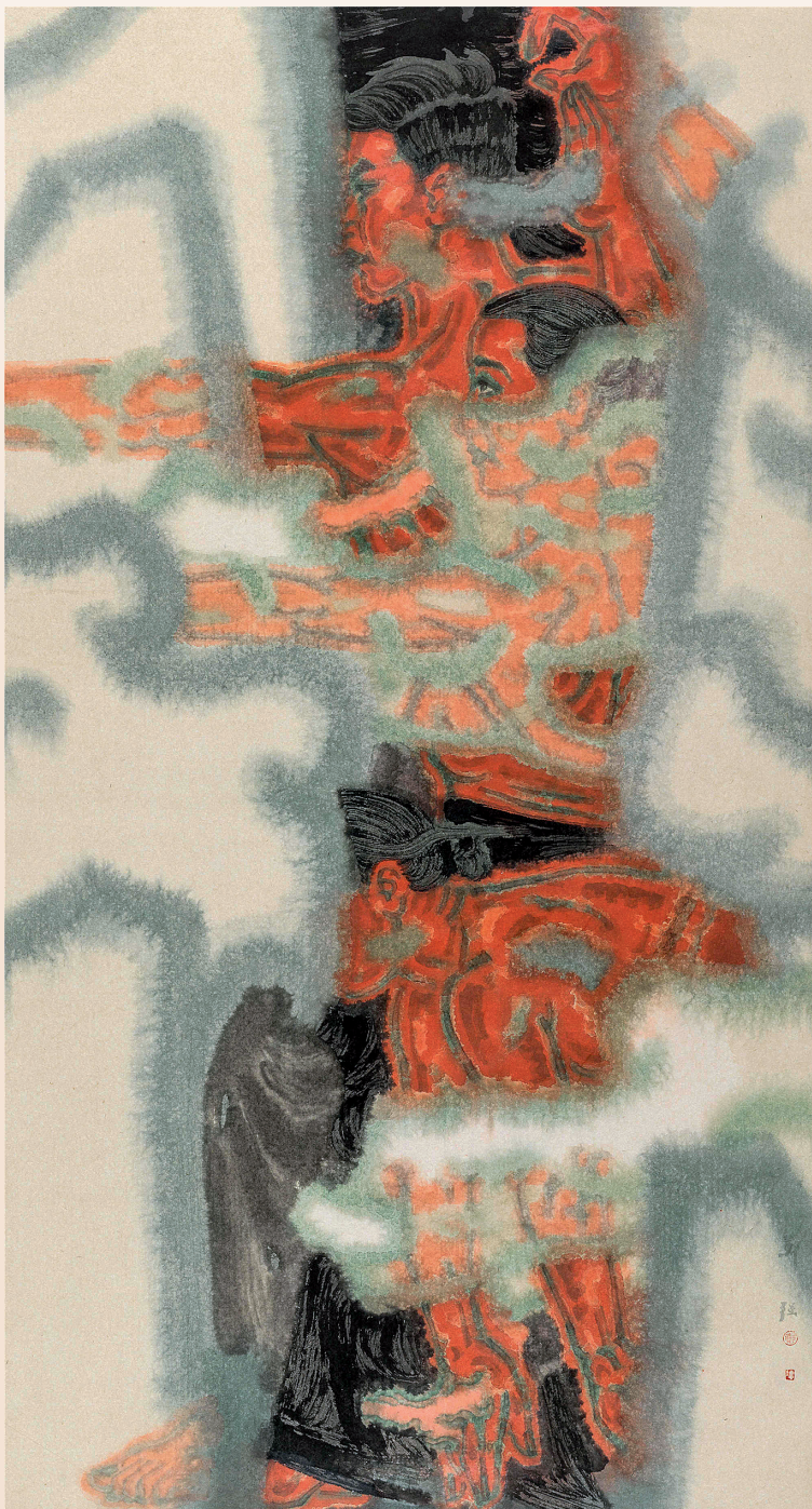
郑强 《前行·十三》 180×97cm 纸本水墨 2018年

深圳设计行业的发展为香港设计业所带动，逐渐形成一些比较优势。深圳拥有为数众多、影响全国乃至世界的设计精英。中国申奥标志就是由深圳人设计的，一批受到国内外设计界好评的作品和作者大都源于深圳。