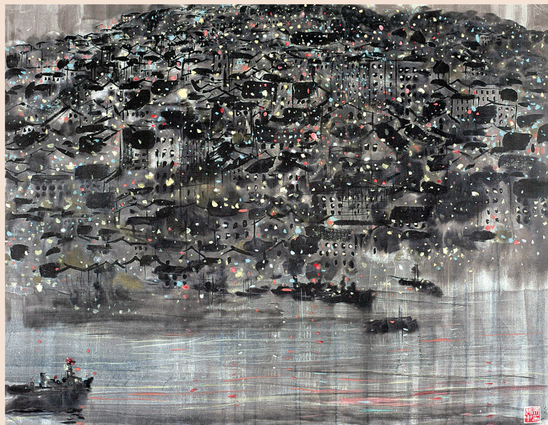
吴冠中《夜重庆》68×88cm 纸本水墨 1979年 深圳美术馆藏