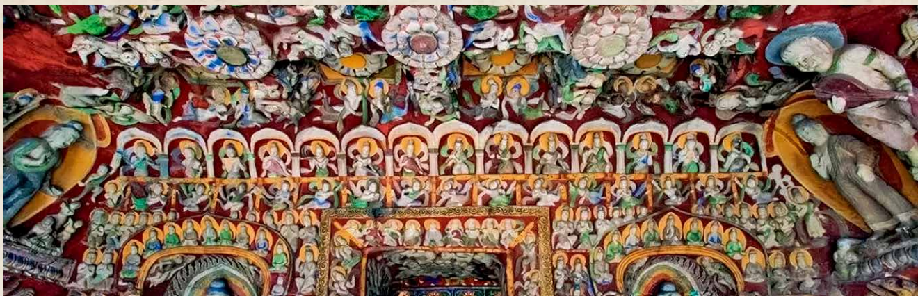
第12窟规模最大的天宫乐伎

全曲融合了公元五世纪以来西域各种典型的旋律风格，曲情印象写意，节奏雄浑热烈，瞬间让观众感受到古代东西文明、南北交融汇聚地——云冈所具有的多元、传奇的色彩。