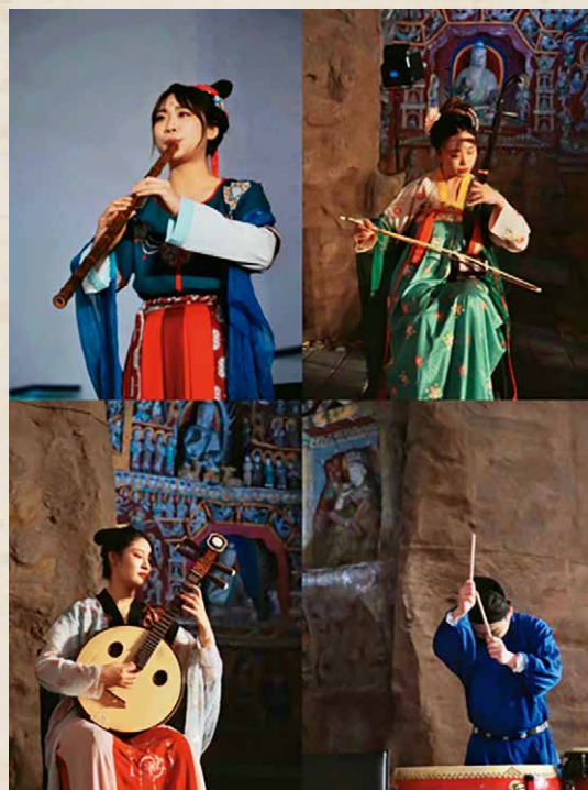
演出现场

它不仅反映了北魏社会的音乐制度及其时代风貌，更是研究中国古代乐器形制、演奏方式以及乐队组合的珍贵历史资料。