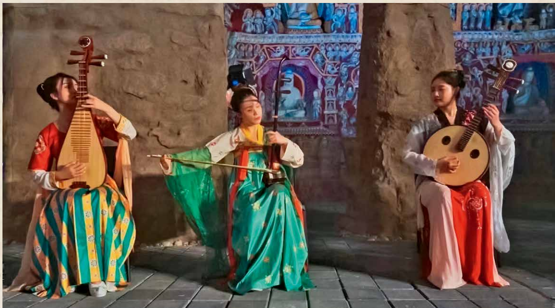
演出现场

“云冈第 12 窟是研究中国古代乐器形制、演奏方式以及乐队组合形式等珍贵的历史资料。在中国乐舞史上占有重要的地位和艺术价值，堪称中世纪器乐“活化石”。这种中西糅合、声部多元的音乐组合编制，深远地影响了后世……”