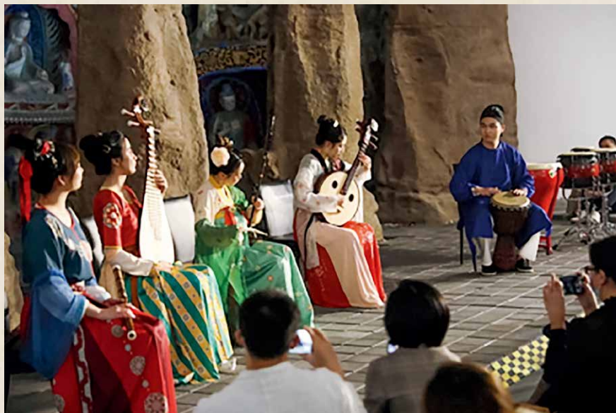
演出现场

随后琵琶、二胡、阮的音乐声一时渐起，一曲改编自经典《游园惊梦》的《春山积翠》，将观众从云冈带入青瓦白墙的江南庭院。