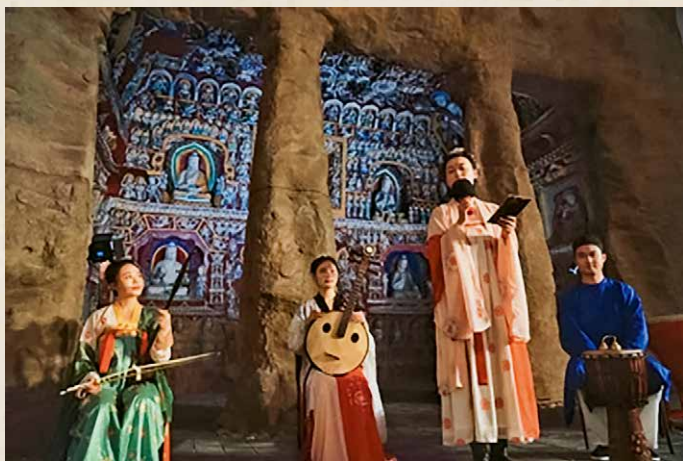
演出现场

随后，雅部院以一首特别编排的《云冈》曲正式拉开音乐会的序幕。《云冈》曲巧妙地运用中国民族古典乐器的特性，采取四个声部、五种古乐的重奏、合奏的方式，让西域调式与印度调式相渗透结合。