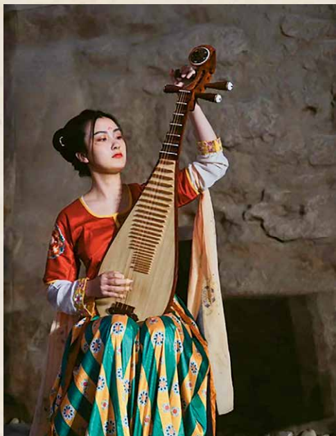
演出现场