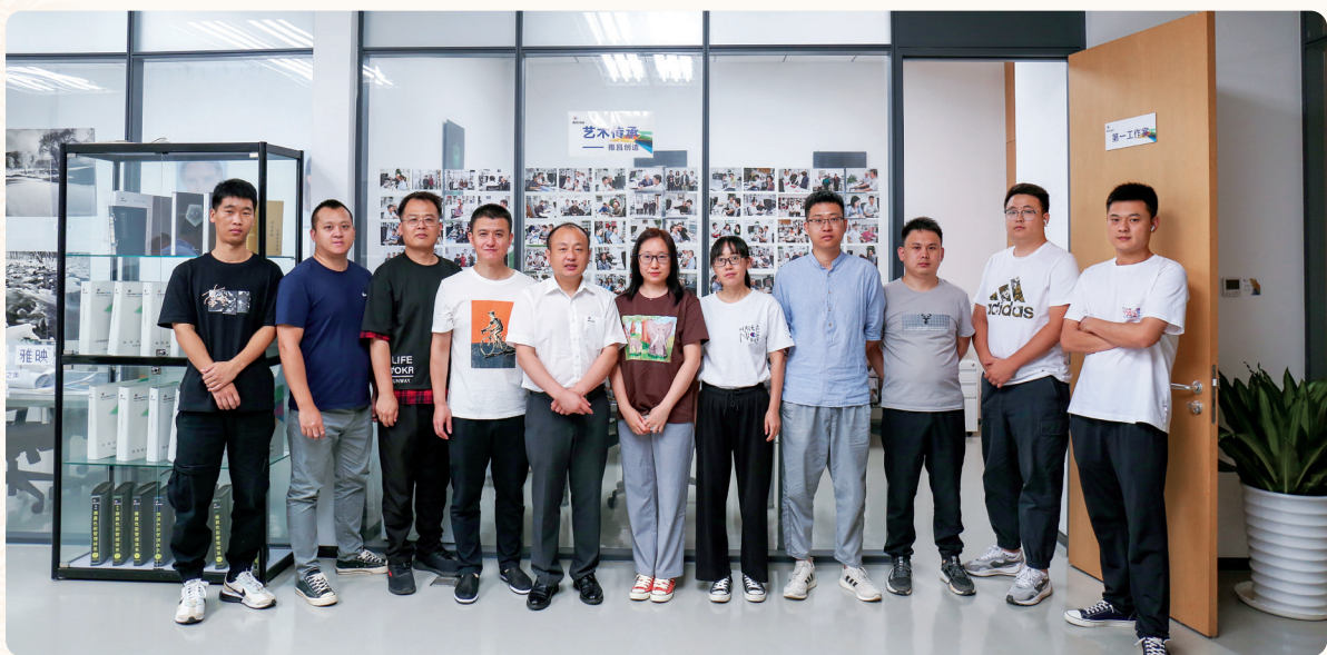
北京数据处理中心团队

“国有盛世、必有雅昌”，这是刻在每个雅昌人骨子里的基因。继70周年庆典后，我们又一次用自己的行动献上对党和祖国深深的祝福。