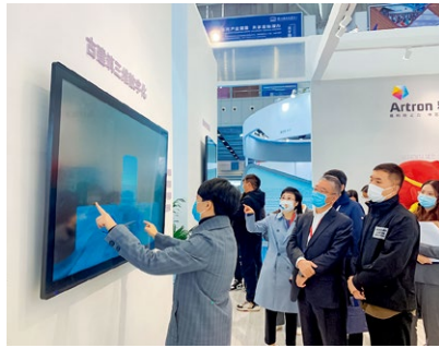
中宣部文改办副主任、一级巡视员高书生莅临指导