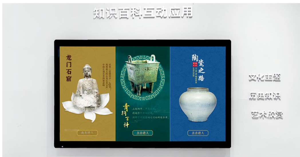
从左至右依次为龙门石窟、青铜百科、陶瓷之路