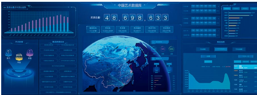
数据可视化管理驾驶舱