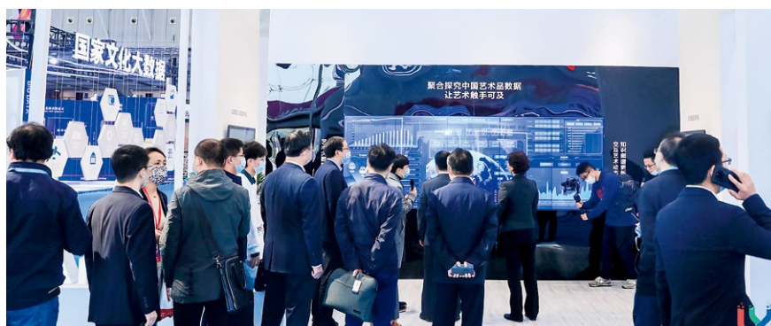
雅昌艺术数据展位现场

全国首个聚焦文化科技融合和文化产业数字化方向的专业性展会——中国（南京）文化和科技融合成果展览展示交易会于2021年10月21日-23日在南京国际展览中心举办，雅昌作为科技部、中宣部、文旅部批准的“国家文化和科技融合示范基地”，此次携科技成果亮相南京国家文化和科技融合示范基地成果展区。江苏省委常委、省委宣传部部