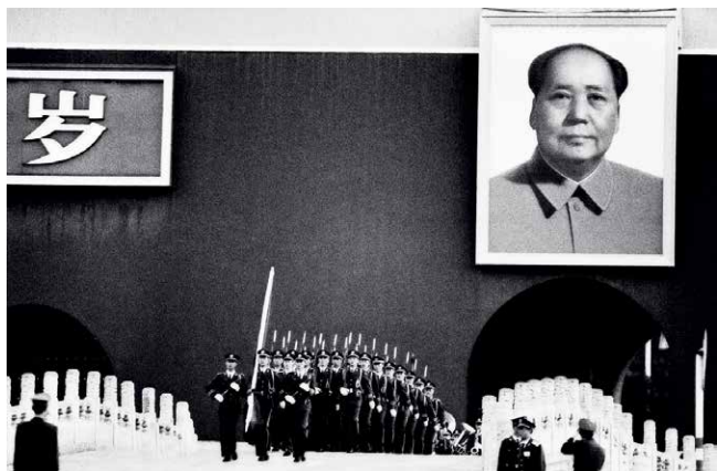
▲ 1989年，北京。天安门举行隆重升旗仪式，国旗班护旗队庄严地走过金水桥。