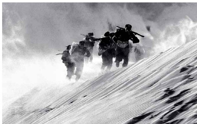
▲ 1989年，兰州。兰州军区某部在腾格里沙漠进行为期几天的吃住行打的适应性训练。