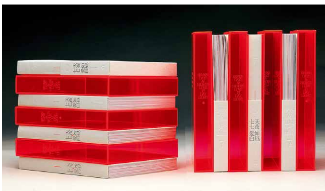
ADC Awards 铜立方奖

恭喜以上获奖的设计师及出版单位！下面就让我们一起来欣赏本年度这两项大奖中由雅昌印制的获奖书籍，感受中国设计的魅力！