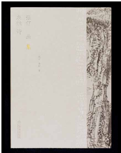
D&AD Awards 入围书籍

全书洋溢着浓重的手工感、民俗感和游戏感，通过内容的结构和设计形式变化，使读者建立起阅读的行为参与感，趣味十足。