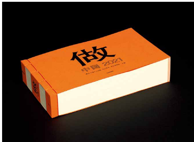
《做——中国 2021》 Do it - China 2021