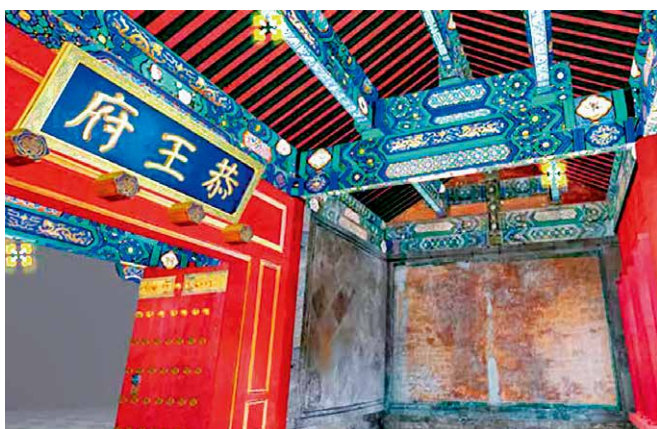
恭王府古建筑三维采集

再说智慧管理： 雅昌用科技构建数字生态系统，铸造“智慧生命体”。构筑智能管理系统，以“智慧大脑”推动博物馆管理更加科学、智能和高效。运用3D技术和交互技术，搭建数据可视化管理驾驶舱，探索、展示艺术品、艺术家和艺术数据的关联，多维度呈现数据内容，拓展数据展示形式，轻松解决各类复杂场景下的应用问题，自由释放艺术数据潜能。具体产品和服务包括：