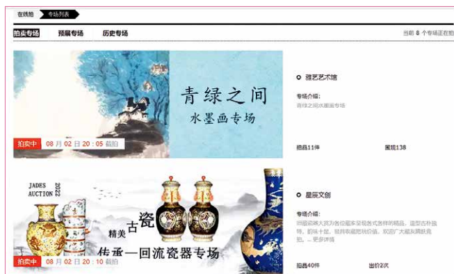
雅昌艺术网“在线拍”截图展示

随着艺术数据和互联网业务的深入开展，雅昌不断整合资源、提升技术、完善产品和服务矩阵，针对艺术家、艺术机构、拍卖行、商业用户等不同类型客户的艺术数