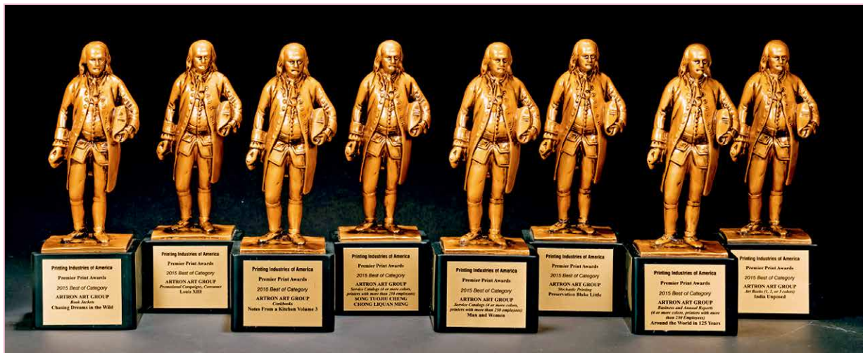
雅昌获得的美国印制大奖

“高品质”和“专业化”是雅昌艺术印刷的最大优势。雅昌为客户提供印前、印中、印后一站式服务，满足从书籍设计、数字采集、图色处理、品质策划、图文处理、印刷装帧、宣传推广到线上售书等所有环节的客户需求。展厅内展示了雅昌承印国家重大印制项目以及在美术、文博、摄影、拍卖、藏家、品牌艺术、海外、国礼8个专项市场和雅昌云印方面的作品，下面，小编给大家逐一进行介绍。