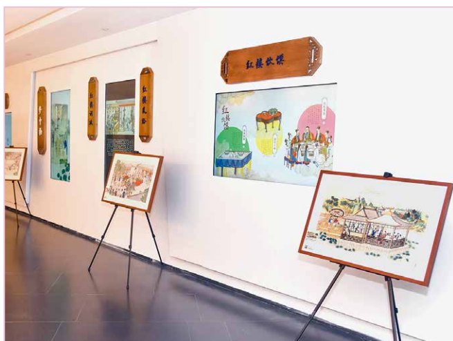
雅昌《红楼·幻境》数字展

学研究成果，通过“科技+艺术”的实践尝试，开发了红楼剧幕、红楼家谱、红楼文化等七大主题。雅昌通过数字技术为中华优秀传统文化《红楼梦》赋能，用更加丰富的介质展现艺术魅力，打造了一个可感、可游、可交互的沉浸式数字文化空间，给古老的文化经典一次全新的数字体验。