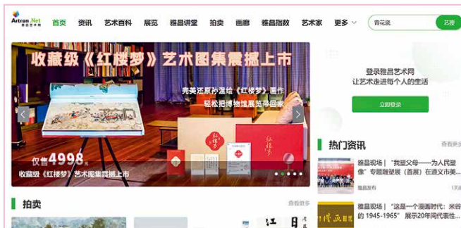
雅昌艺术网截图展示

1. 提供艺术数据： 雅昌线上平台提供了大量关于艺术家、艺术机构、艺术品的真实数据，方便艺术爱好者了解全面翔实的数据。雅昌每年适时发布艺术行业专业市场调查报告和“雅昌指数”，并推出“拍卖图录”app，为用户提供丰富的艺术数据。为了方便用户获取数据，雅昌还开发了信息搜索引擎“艺搜”。