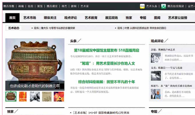
雅昌艺术网发布的艺术资讯

3. 促进艺术交易： 通过打造艺术交易线上平台，雅昌建立了艺术家、艺术机构、艺术店铺的展示和售卖渠道，方便艺术从业者、投入者、追随者交流和购买，让