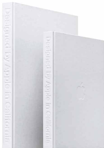
雅昌印制的《苹果》一书

如今，雅昌已成为中国乃至全球艺术印刷领域的领军者，我们将一如既往，为实现从“为人民艺术服务”到“艺术为人民服务”的使命砥砺前行，为保护、传承与弘扬中华优秀传统文化添砖加瓦，为传播中国文化、促进世界文化交流贡献自身力量。