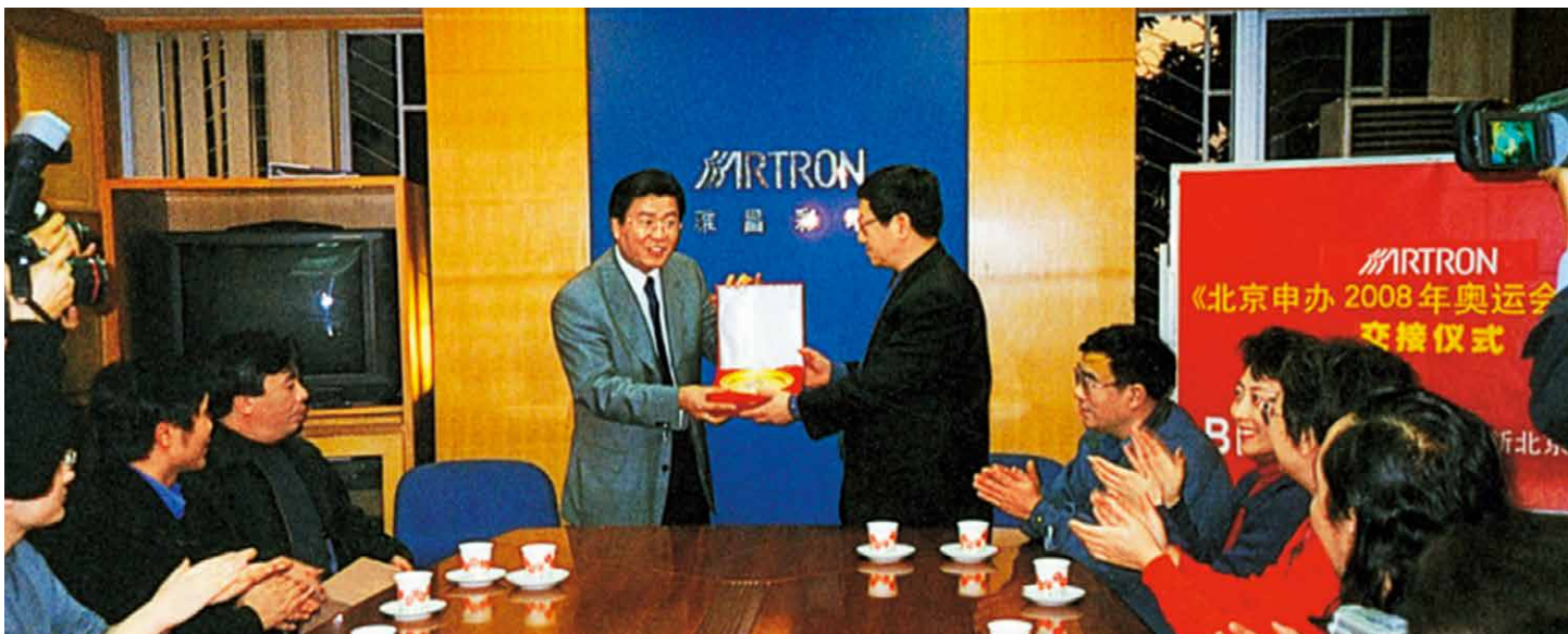
《北京2008年奥运会申办报告》交接仪式