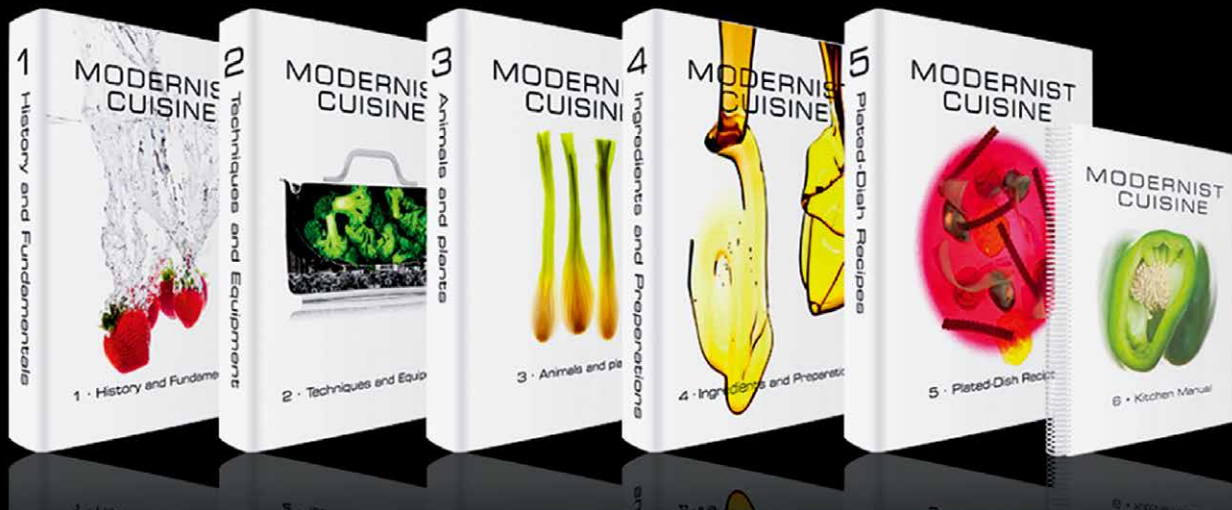
《现代主义烹调：烹调艺术与科学》

由雅昌艺术印制完成的《现代主义烹调：烹调艺术与科学》，采用独创的雅奕专利彩印技术，完整地精准呈现高速摄影艺术的细腻美感，该书获全球权威印刷工会 PIA 年度印刷大奖食谱书首奖和 2013 年美国印制大奖班尼金奖。