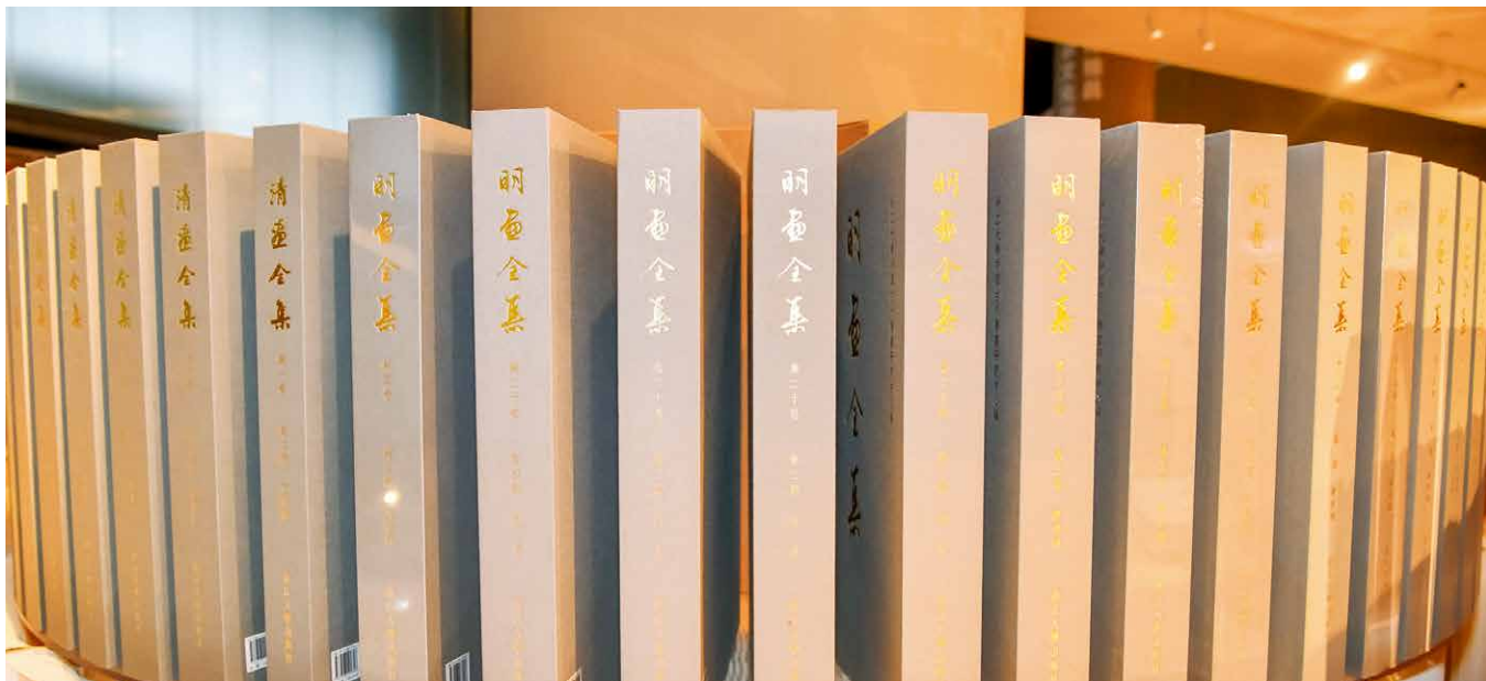
中国历代绘画大系