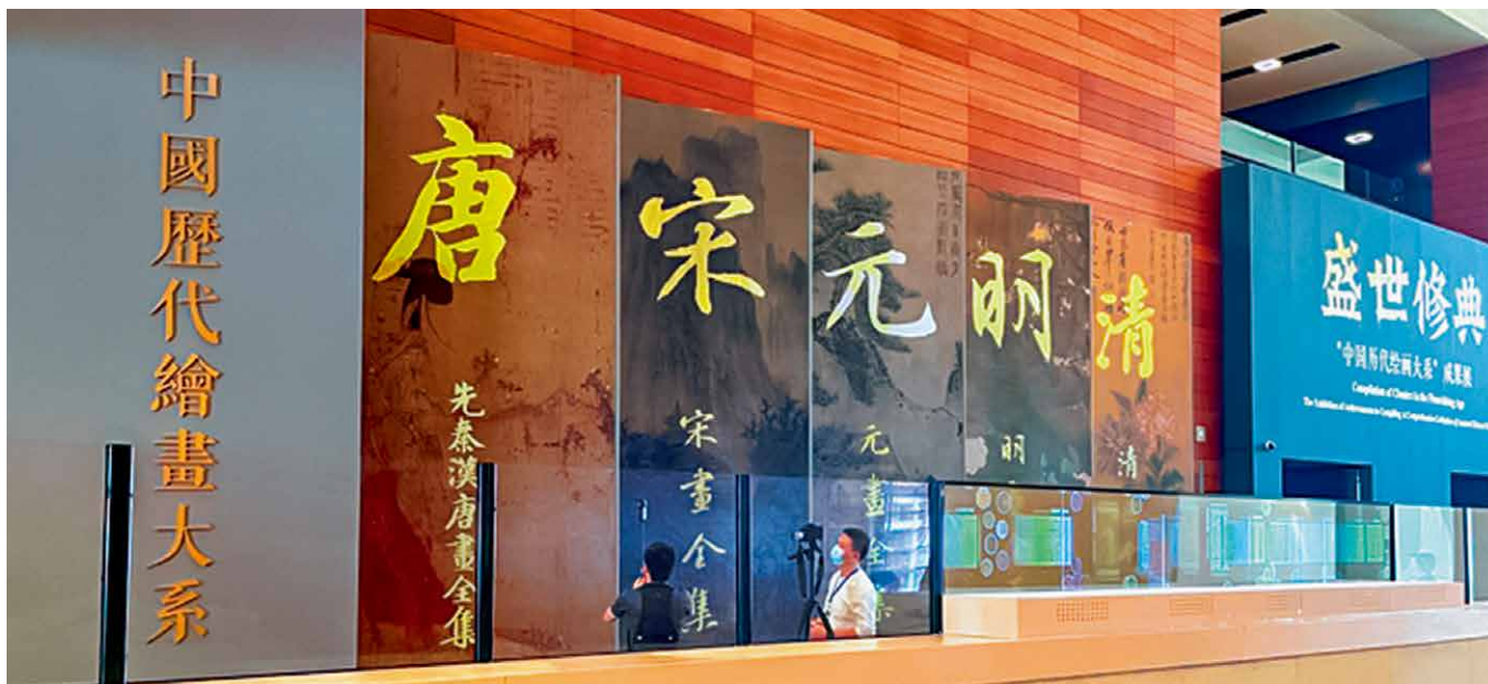
“中国历代绘画大系”成果展