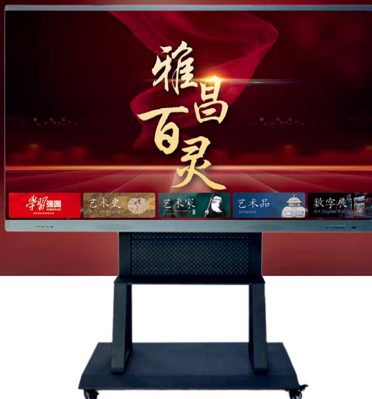
雅昌百灵智能一体机

立足基础业务，拓展全新领域，雅昌艺术数据不断尝试走出舒适圈。在数字化发展的今天，谁先迈出跨界的第一步，谁就能掌握最优的主动权，探索、尝试、螺旋前进，雅昌艺术数据敢为人先。