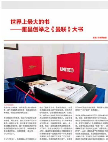
选自第 34 期

2006 年 11 月,《曼联》大书成功面市,它不仅是雅昌人的骄傲,更是当时世界媒体瞩目的焦点。其书芯尺寸半米见方,搭配厚重的皮质外壳和气质非凡的书盒,彰显出无与伦比的尊贵与奢华。这部宝典承载着曼联足球俱乐部 130 多年的历史,以超过 2000 幅珍贵图片和 40 万字的内容,展现了曼联的辉煌。