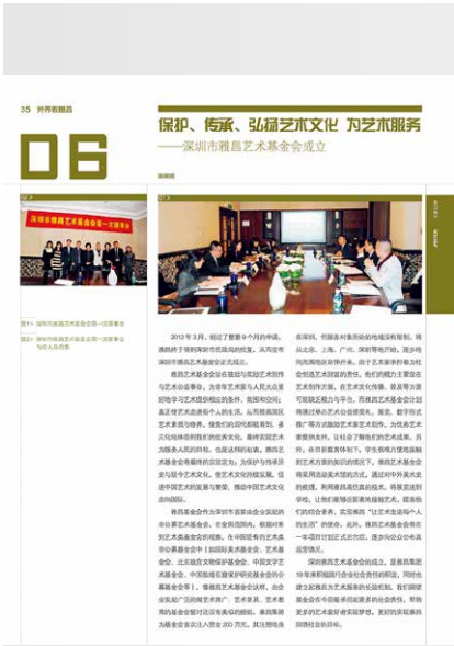
选自第 55 期

2012年3月，深圳市雅昌艺术基金会正式成立。基金会旨在促进艺术创作与艺术公益事业，为青年艺术家与人民大众更好地学习艺术提供相应的条件、氛围和空间；真正使艺术走进每个人的生活，从而提高国民艺术素质与修养，体验中华优秀传统文化，最终实现艺术为服务人民的目标。