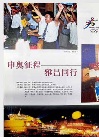
选自《北京版》第 1 期

凭借着这本登峰造极的申办报告，雅昌助力北京一举赢得 2008 年奥运会的主办权。中国漫漫奥运之路的第一步，雅昌便印下了足迹；这一步，也锻造了雅昌人顽强拼搏、勇于奉献、使命必达的企业精神，这笔宝贵的精神财富支撑并引导着雅昌在未来的路上不断勇攀高峰，不断创造印艺奇迹。