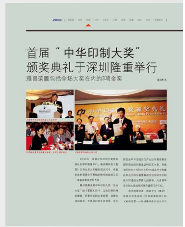
选自第 38 期

该书凭借 500mm×500mm×90mm 的超大尺寸和 35 公斤的惊人重量,成为当时印刷技术的巅峰之作,彰显了雅昌品牌的卓越品质。雅昌此次获奖,不仅为自身赢得了荣誉,更为整个印刷行业树立了标杆。