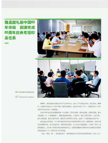
选自第 43 期

2009 年,适逢新中国成立六十周年,雅昌再接再厉,献礼祖国——圆满完成六十周年庆典专项印品任务,再获赞誉。本次专项印品包括 6 款请柬(大会请柬、招待会请柬、联欢会请柬、成就展请柬、复兴之路请柬、九一八预演请柬)、64 款成就展参观券、大会简介、复兴之路节目单、大会手册、复兴之路画册、复兴之路节目单、联欢会节目单等百万余份,远超十万册的奥运专项产品!