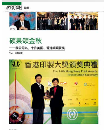
选自第 19-20 期

2002 年 9 月、10 月，雅昌分别摘取了来自代表世界印刷最高水准的——“美国印制大奖”和“香港印制大奖”。