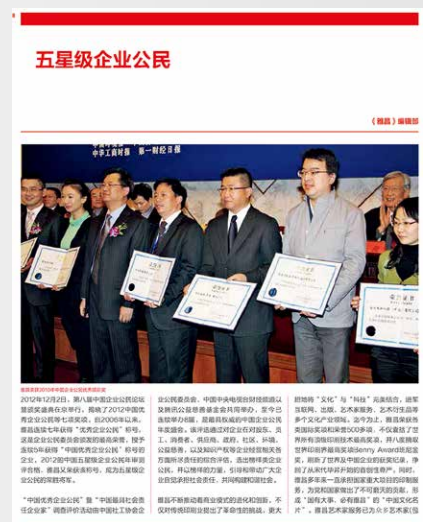
选自第 58 期

公益慈善与知识产权：雅昌在公益慈善方面也做出了积极贡献，如联合故宫博物院发起文物保护基金会，注重知识产权保护，为客户提供了安全的商业环境。