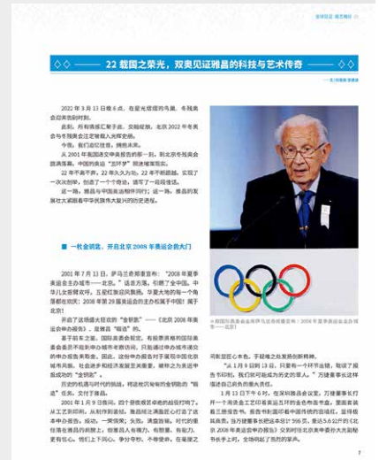
选自第 95 期

雅昌文化集团凭借着精湛的印刷技艺与热忱的爱国情怀，成为了中国唯一一家印艺领域服务双奥运的企业！