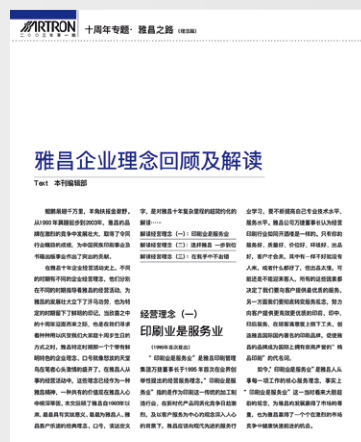
选自第 21 期

1997 年，万捷董事长提出了崭新口号：在我手中不出错。时至今日，这个口号仍然可以是每一个雅昌人的座右铭。