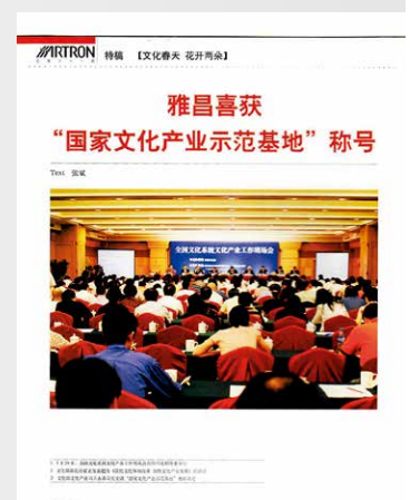
选自第 31 期

如今, 雅昌已成为中国乃至全球艺术印刷领域的领军者, 我们将一如既往, 为实现从“为人民艺术服务”到“艺术为人民服务”的使命砥砺前行, 为传播中国文化、促进世界文化交流贡献自身力量。