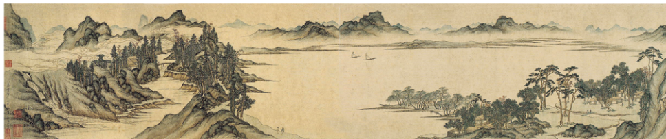
文伯仁 秋山遊覽圖