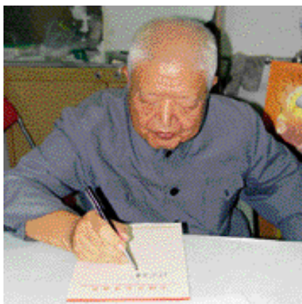
史树青 著名学者、史学家 文物鉴定专家