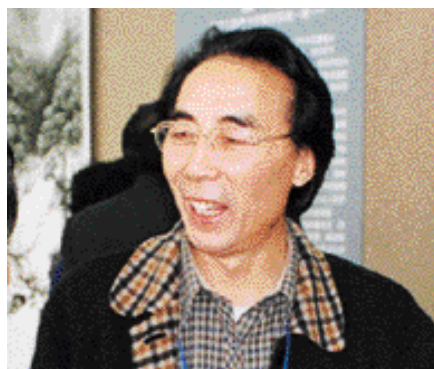
宋雨桂 著名书画家 辽宁美术家协会 主席

我和雅昌是真正的朋友，和雅昌人交往能感受到他们是十分真诚的，完全是朋友之间在共同做些事情。我有活愿意放到雅昌去，有安全感，没活也愿意到雅昌去，去看老朋友。雅昌是印刷界的一个榜样，领导着印刷界的潮流，希望雅昌成为印刷界的“太阳”。