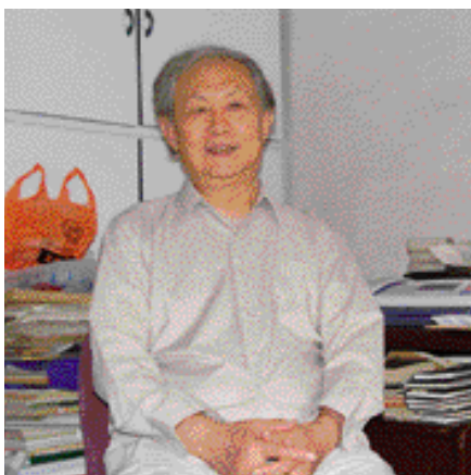
杨伯达 文物鉴定专家 中国玉器研究委员会主任 故宫博物院原副院长