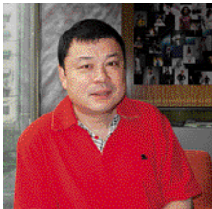
邓伟 著名摄影家 世界名人肖像摄影家

祝福你：晨光中的少年。祝愿“少年”明天更加辉煌灿烂，同时借此机会非常真诚地对雅昌的朋友们说声“谢谢”。