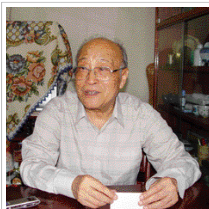
吕济民 国家文物局博物馆专家组 组长 国际博协中国国家委员会 主席