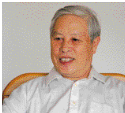
胡政光 九届全国政协常委 原深圳市人大常委会副主任