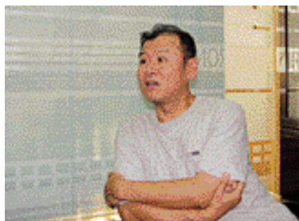
申少君 著名书画家

我和雅昌是有缘分的。衷心希望雅昌越做越好，无论公司发展到什么程度的规模，都要不改初衷，要有平常心，不管客户大小都要一视同仁，继续提高产品、服务质量，及公司员工的整体素质。