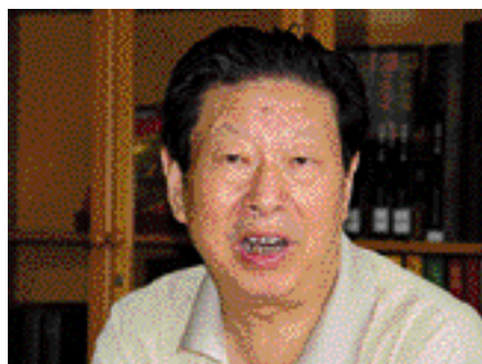
肖峰 中国美术家协会 副主席 中国美术学院 院长

我见到过许多雅昌印刷的画集，尤其是我们学校出版的《林风眠之路》，我感觉他的印刷达到了国内顶尖的水平。在我周围有一种说法：“要搞分色、制版，就去深圳找雅昌”。我知道有很多人为了到深圳来找雅昌印画册，往返坐飞机，不惜花费很大的成本。可见雅昌在全国树立了一个行业的威望和信誉，是一个非常文明的企业。雅昌是我们美术界的好友，是我们美术家可以依托的重要伙伴，有了雅昌，我们的艺术才可以推向千千万万的观众，外国的朋友拿到我们送给他们的画册感到很惊讶，说想像不到中国的印刷能够做到这样出色。雅昌在改革开放后的20年里，只用了10年时间，就走完了国外印刷同行100年时间的路程，为中国印刷界作出了巨大贡献。