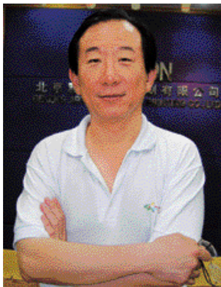
杨大洲 著名摄影家