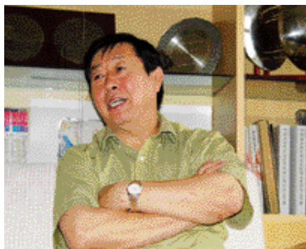
刘大为 著名书画家 中国美术家协会 常务副主席

对画家来言，好的印刷品是对画家心血的一种尊重和保护，雅昌的努力为我国绘画艺术界作出了巨大的贡献。