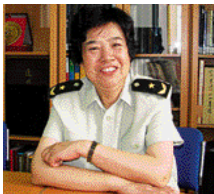
邵华 将军 著名摄影家 中国摄影家协会 主席