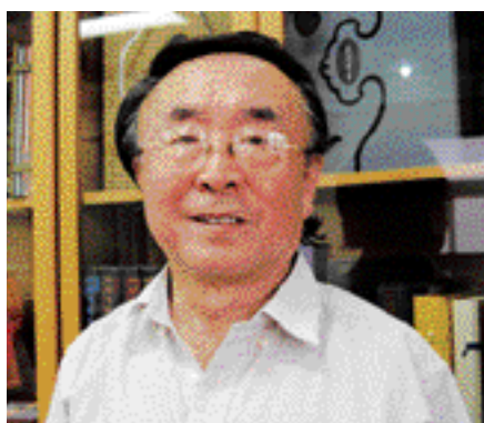
吕厚民 著名摄影家 中国摄影家协会 顾问