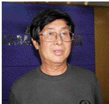
李少白 著名摄影家

最后，我只想用一句话广而告之：北京雅昌给我带来了好运，好运来自北京雅昌超群的印刷品质！