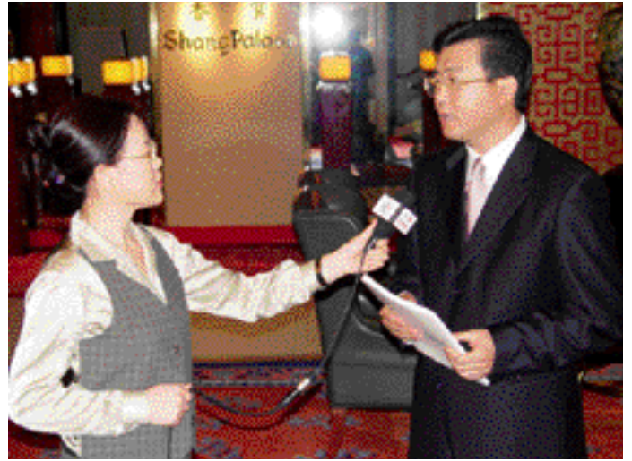
万捷董事长在香港接受中央电视台驻港记者的采访