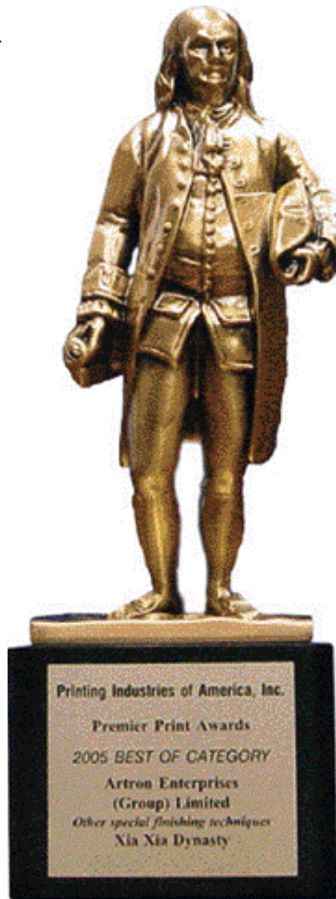
2005 Benny Award金奖奖杯