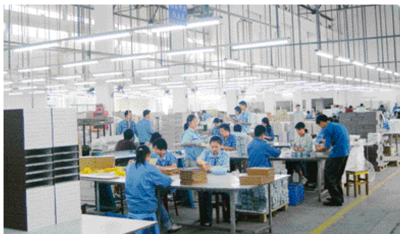
制版车间通透明亮，光线极好 气势恢弘的印刷车间 装订车间