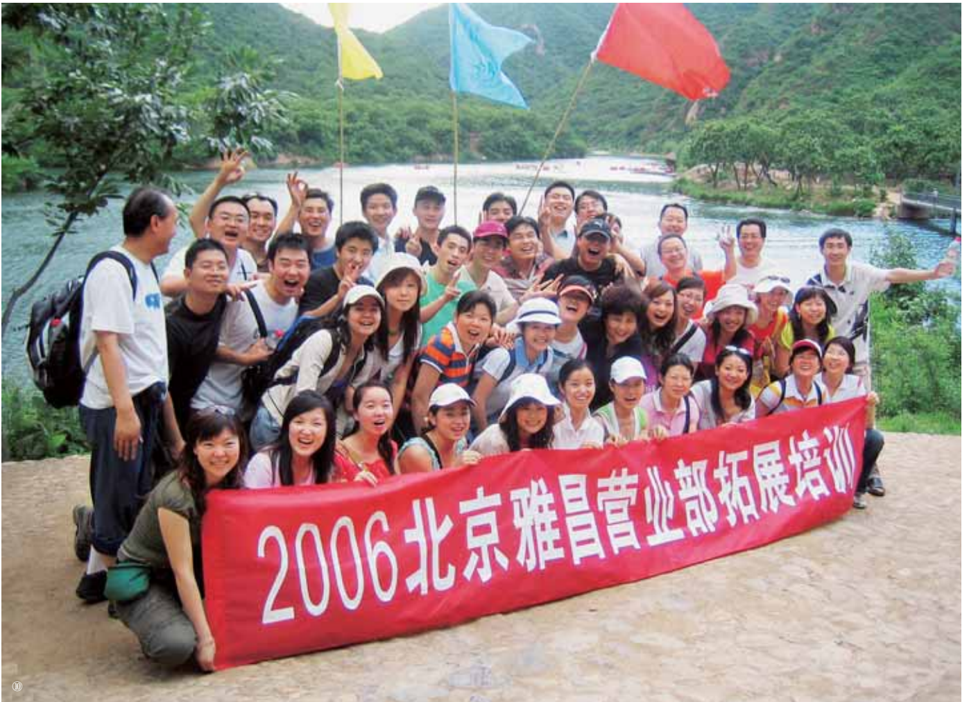
1/2/3 北京西水峪水上长城风景区壮丽秀美的景色