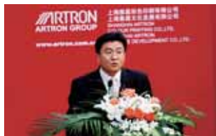
特稿 / 见 10 页