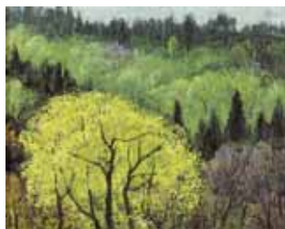
封面图片·春讯 作者:朱乃正 尺寸:40×50 cm 雅昌艺术馆收藏