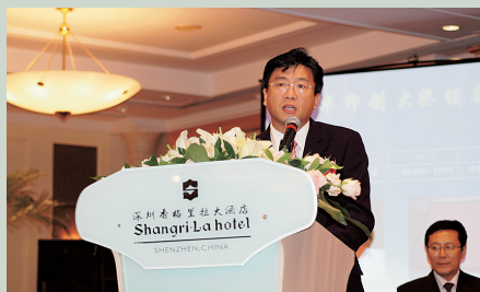
万捷董事长在颁奖晚会上发表演讲