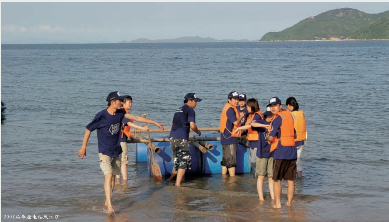
2007届毕业生拓展训练

目标；第三是能力开发。根据员工的不同情况，利用培训、工作实践、轮岗、职业指导等措施提升员工的能力。不仅可以在同一职业系列纵向晋升，还可以在不同职业系列横向移动。第四是检查评估。通过定期检查，对员工能力进行评估，分析员工是否实现了岗位目标和达到了成长要求。通过这一开放式的互动设计平台，采取多种手段帮助员工不断地成长，挖掘员工的发展潜力，促使员工保持健康积极的心理素质，提高自己的工作能力，这些措施的有效实施不仅留住了公司内部的关键人才，还吸引了公司外部大量的优秀人才的加盟。真正实现员工能够随着公司稳步发展的同时，也获得个人职业生涯的不断进步。