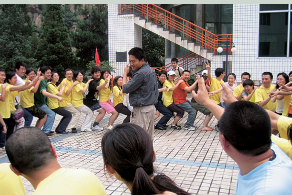
队员们在教练带领下做游戏

工作中，我们常会找一些不合适的参照物（参考值），并不容易被别人发现。等到全盘皆输，回想起来才知道是参照物的错误，这是多么可悲呀！