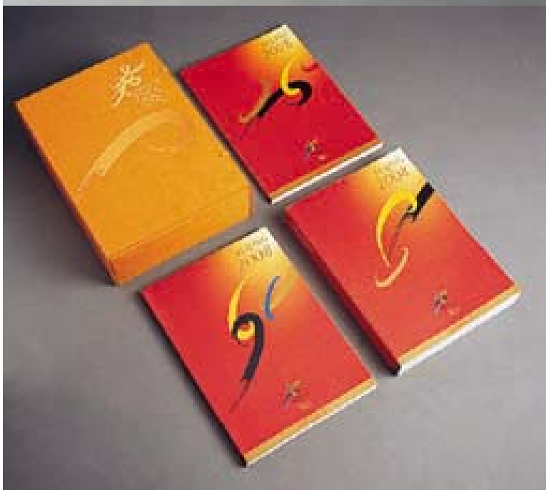
《北京2008年奥运会申办报告》 共印制了450套

《北京2008年奥运会保证书》 共制作了2套，正本现存瑞士 洛桑国际奥委会总部，副本 现存于北京奥申委。