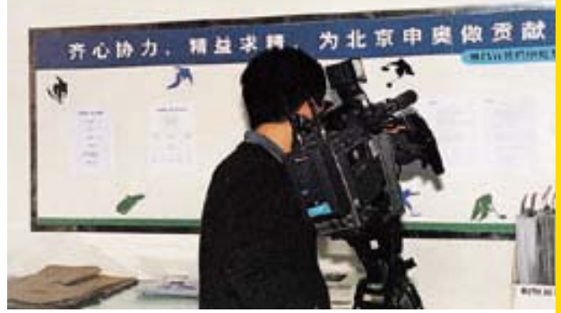
雅昌申奥专栏吸引中央电视台记者的目光