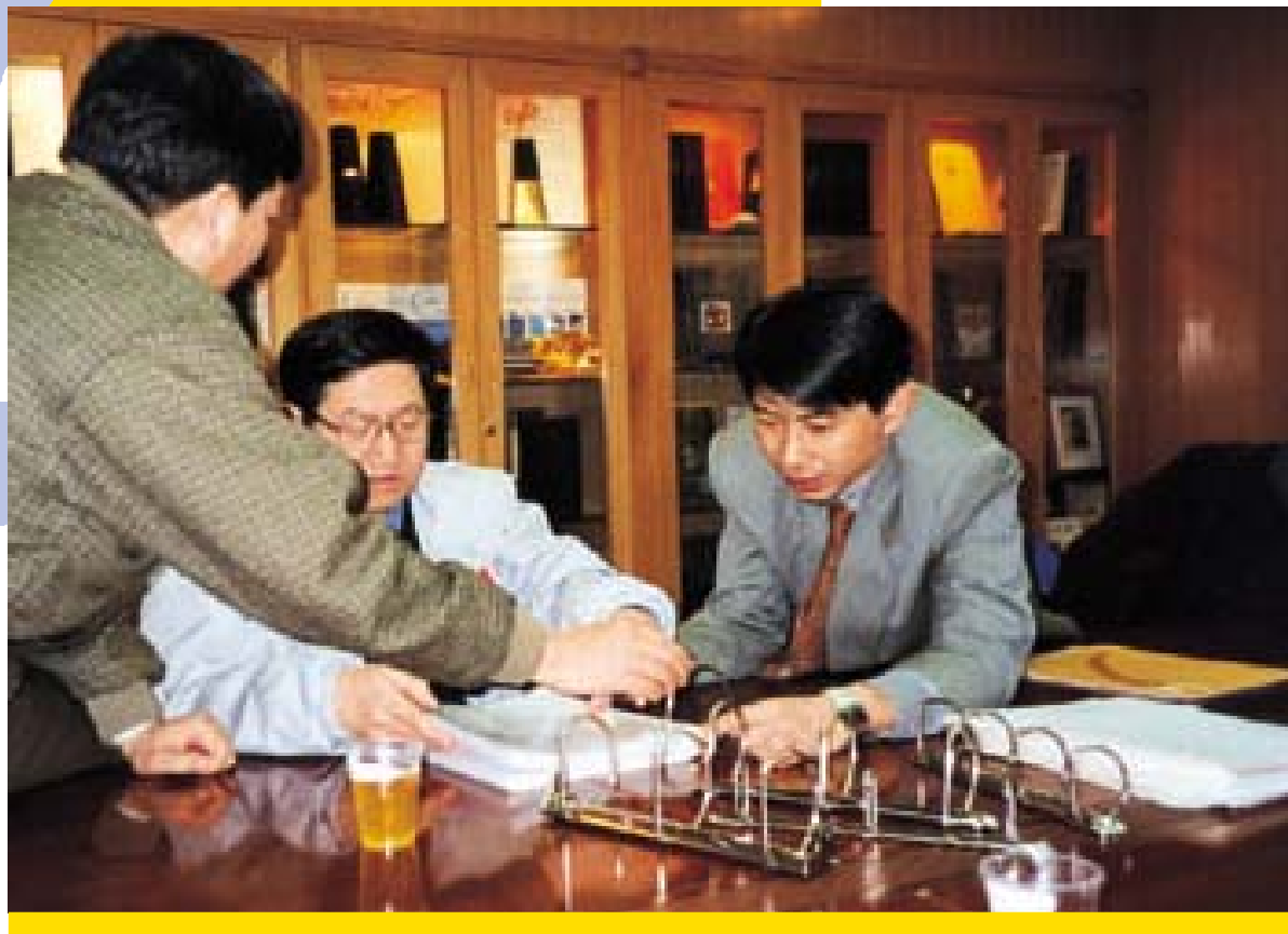
我公司工作人员向奥申委领导介绍三孔文件夹