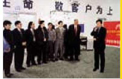
万捷董事长在开机仪式上代表雅昌彩印公司讲话