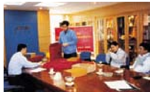
共同研究《申办报告》装帧设计