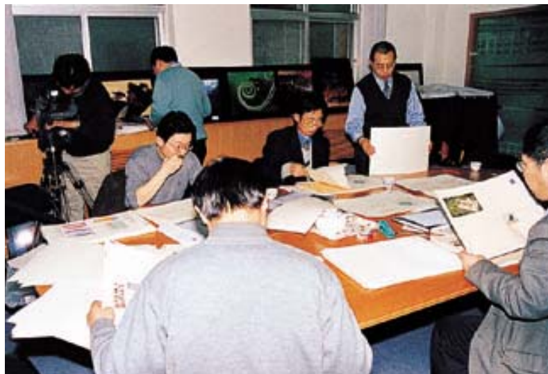
精心录制《申办报告》印制过程

中央电视台派出了专门的记者组，在雅昌度过了四个不眠之夜，全程跟踪录制了《申办报告》印制的每个细节过程。他们说这里每一个镜头都非常珍贵