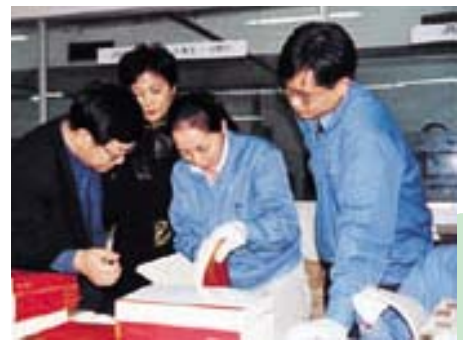
每一页都是完美的