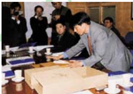
我公司工作人员向奥申委领导介绍《申办报告》与《申奥保证书》的装帧设计