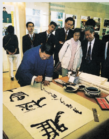
艺术家在八周年庆典酒会上即兴题字“雅极昌盛”