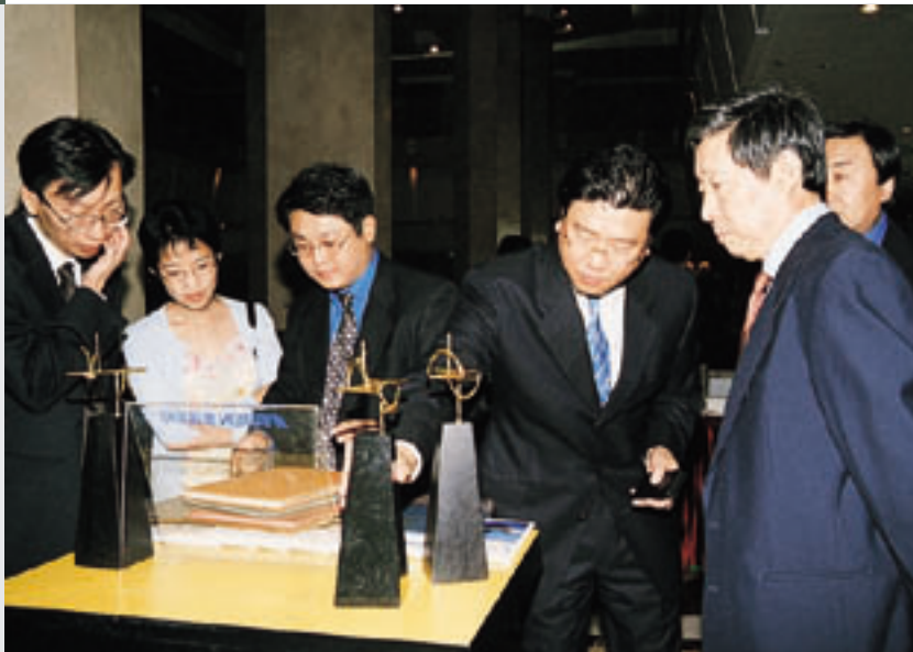
万捷董事长(左四)向客人介绍公司所获得的香港印制大奖

庆典酒会上,著名画家申少君先生代表施大畏、唐勇力、刘进安等十一位著名画家向公司赠送他们为雅昌八周年合作创作的国画精品