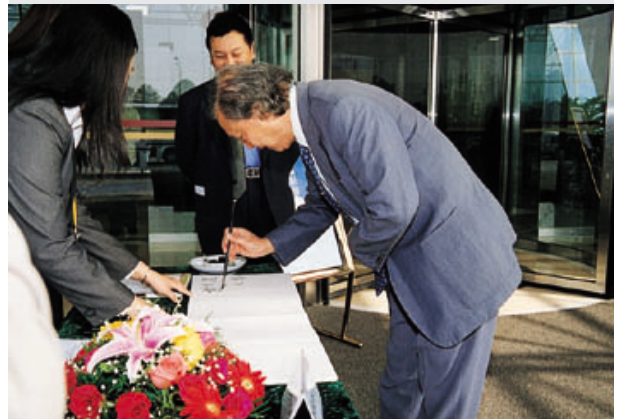
文物鉴定家杨伯达先生签名