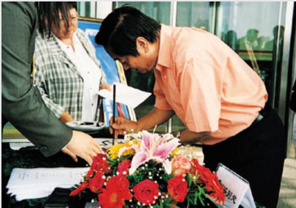
著名艺术家韩美林先生欣然签名参加 公司八周年庆典暨北京彩印大厦奠基仪式