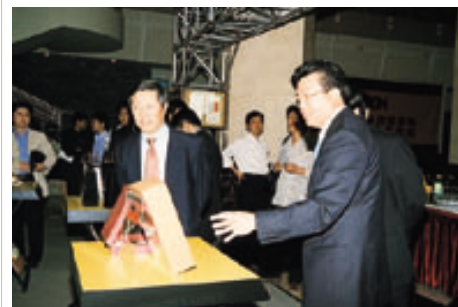
万捷董事长(右一)向客人介绍公司印制的《北京2008年奥运会申办报告》