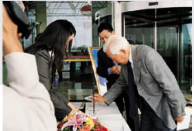
文物鉴定家耿宝昌先生签名留念