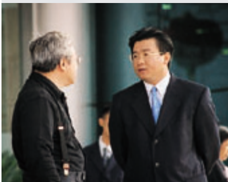
万捷董事长(右一)与客人亲切交谈