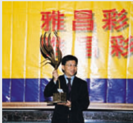
韩美林先生(右一)为雅昌八周年庆典及北京雅昌大厦奠基仪式赠送雕塑作品