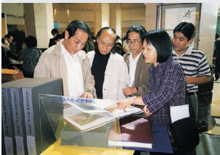
《百年中国画》画册精美绝伦