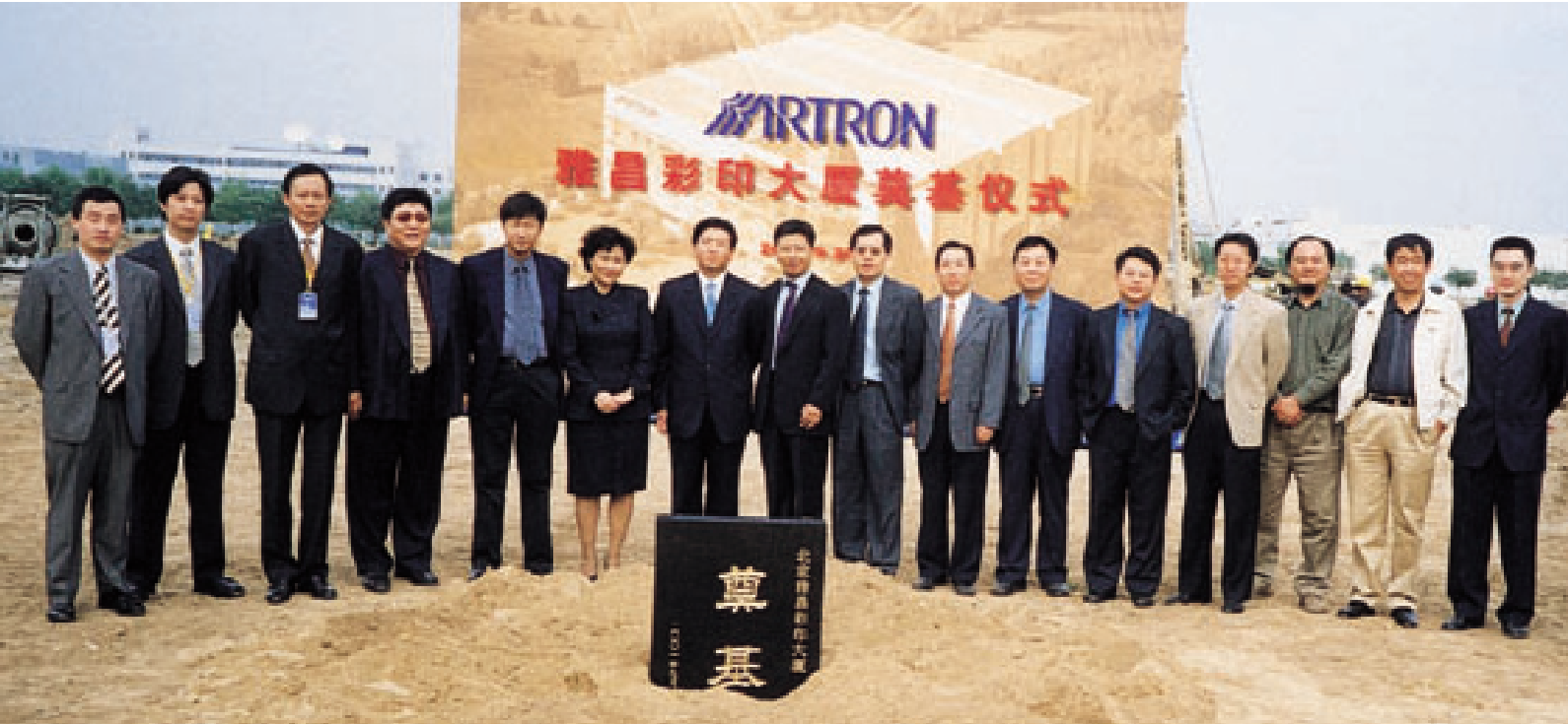
公司领导与有关人员在北京雅昌彩印大厦奠基仪式现场合影留念