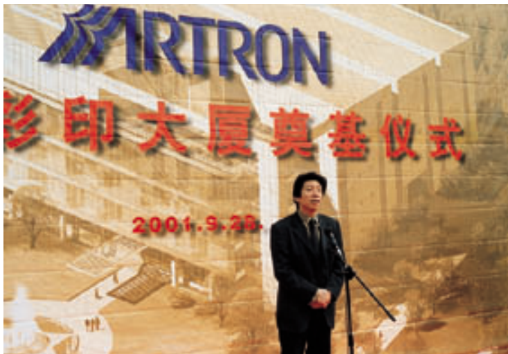
中央美术学院范迪安副院长在奠基仪式上发表热情洋溢的讲话