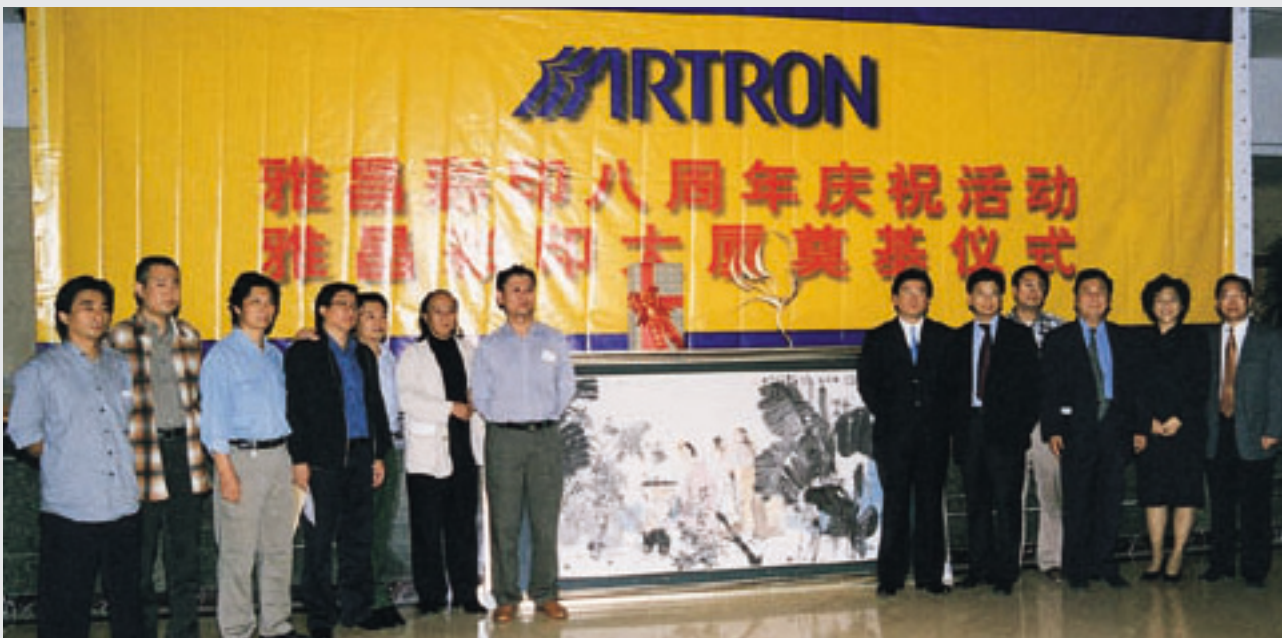
京、沪、深三地十一位著名画家为雅昌八周年庆典赠送巨幅画作《游春图》