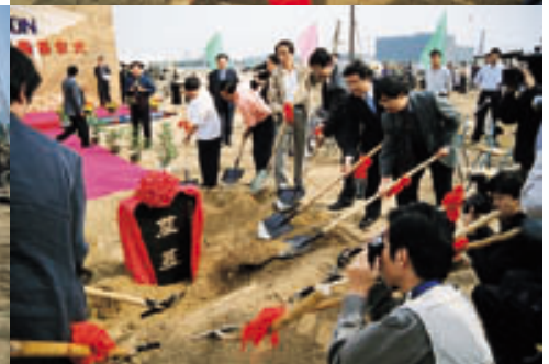
为北京雅昌彩印大厦奠基