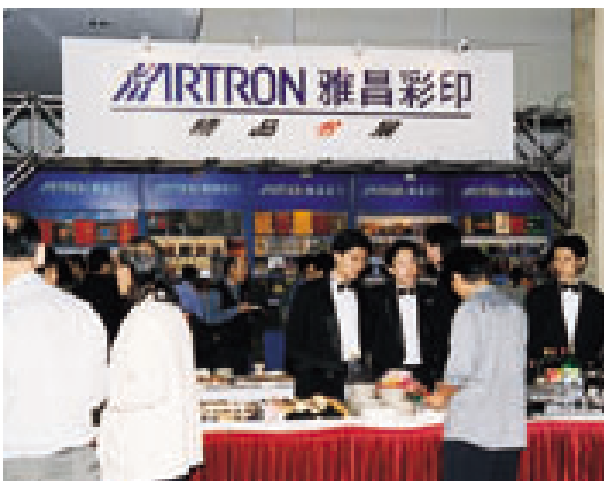
八周年酒会人头攒动