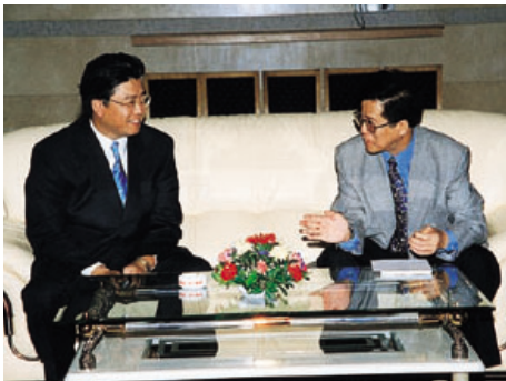
万捷董事长(左一)与客人亲切交谈