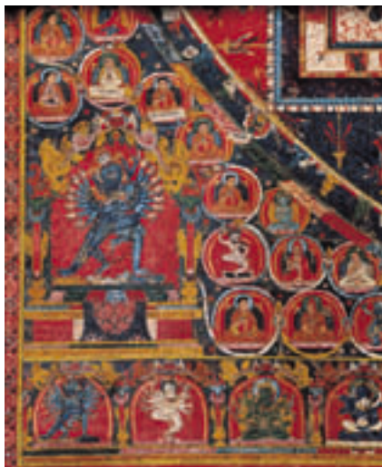
时轮坛城唐卡(局部)

经幡正是西藏文化多元化的色彩体现。扉页整面铺满了经幡图案，而每个开章页却只运用一条经幡，这正是包装盒线、面呼应的再现。画册的开章页和文字页常用黄底色，其目的是顺应当前佛教在西藏占主导地位的教派—黄教的颜色。每个开章页的左侧页则尽力体现藏传佛教寺庙的气氛—在漆黑的殿堂内，哑油透穿露出明亮的经幡与象征酥油灯的开章文字闪闪发光。每个开章页右侧页哑油透穿出的光亮图案，既打破版面的宁静，又显现藏民族文字之神秘。