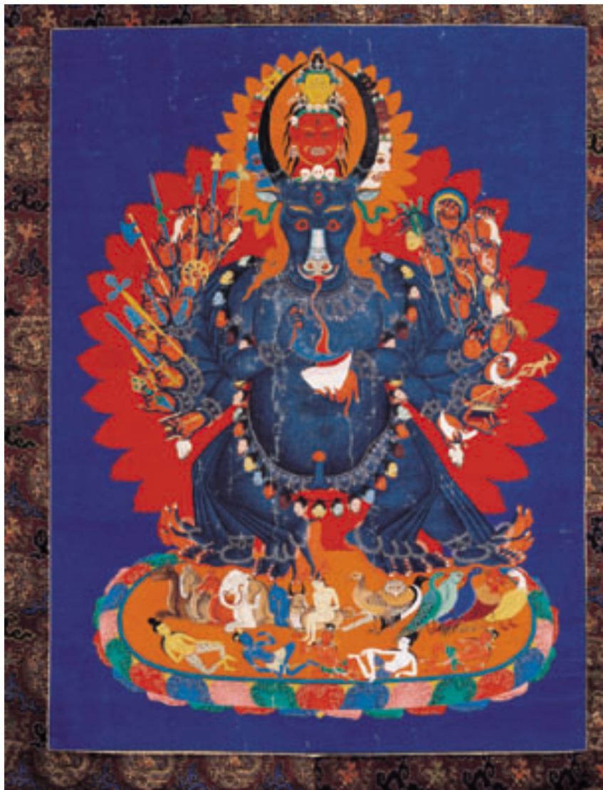
大威德怖畏金刚像唐卡