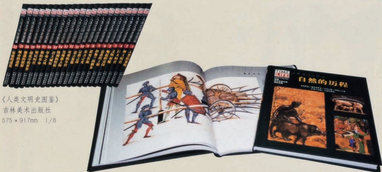
《人类文明史图鉴》 吉林美术出版社 575 × 917mm 1/8

《人类文明史图鉴》是由美国时代生活公司授权吉林美术出版社出版发行的一套集艺术欣赏、科普教育、史学研究、生活娱乐于一体的“百科全书”式的大型丛书。该书以人类文明历史衍生的时间线索为主线，为读者展示了人类的进化发展和社会更替的整个过程。从公元前46亿年的“人类的黎明”至太古代、古生代、中生代、和新生代（公元前6500万年—现在），期间发生在地球上一切有关人类的重要活动及人类对自然界影响