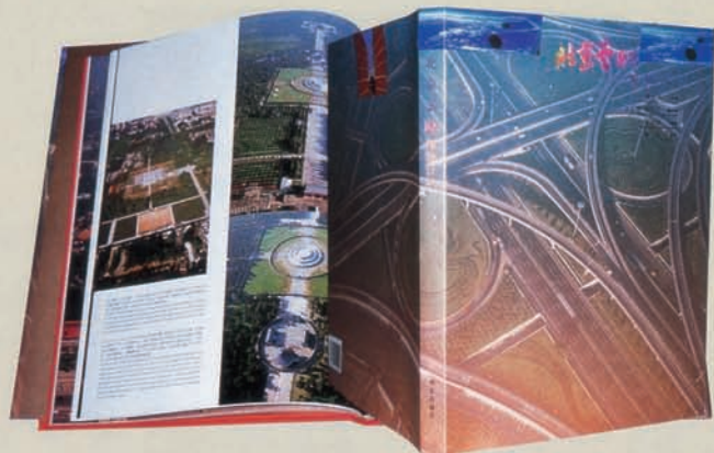
《北京云眸》 华艺出版社 787 × 1168mm 1/8

中国商业摄影需要与国外同行交流。中国商业摄影与自身相比虽然进步很大,但与世界最高水平之间还存在着距离。桥总是伴随着人们向前的脚步而延伸,伴随着人类文明的发展而发展。《中国商业摄影年鉴》将会是一个不断扩大的系列,它会见证中国商业摄影的进步的,更希望通过这座桥梁,使中国的商业摄影走得更快更远。