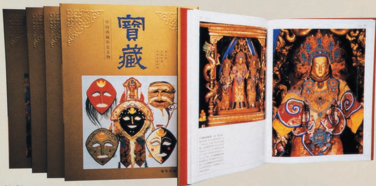
《宝藏》 北京朝华出版社 889×1194mm 1/16

本画册选用的文物,不仅历史跨度大,文化层面广,且多数在此之前鲜为人知,属于首次发表。每幅图片的说明文字,除介绍所示文物的历史价值、文化价值、艺术价值外,还提供了不少背景资料,使画面内涵更为丰富,更具立体感。综观全书,这是一套集学术研究 with 品鉴珍藏于一体的大型画册。