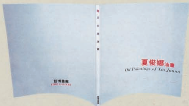
《夏俊娜油画》 艺博画廊 787 × 1092mm 1/12