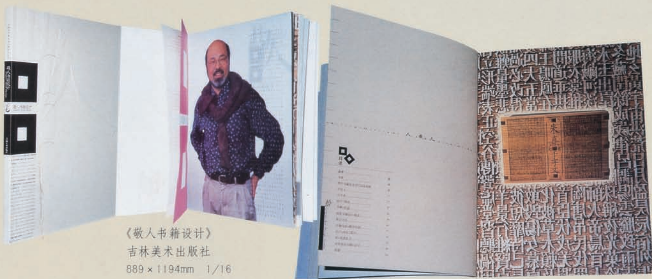
《敬人书籍设计》 吉林美术出版社 889 × 1194mm 1/16

重大的一系列事件，均以图文并茂的方式予以生动再现。对同时代的描述中，各大洲的情况无一不涵盖在内。《人类的黎明》、《神的时代》、《文明初曦》、《巨人时代》、……《东方之光》、《宗教之战》……《发现新大陆》……《革命之风》……《城市的进程》……《战争机器》、《自然的历程》。人类文明的精粹皆浓缩于这二十四部浩然长卷之中。