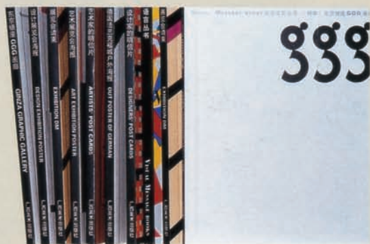
《视觉语言丛书》 广西美术出版社 887 × 1194mm 1/64