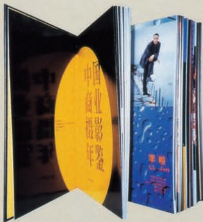
《中国商业摄影年鉴》 山东美术出版社 889 × 1194mm 1/16

在20世纪的最后20年中,商业摄影在中国的发展速度可以用“惊人”两个字来形容。现在,大多数中国人每天都会面对各式各样的商业摄影作品,有意无意地接受着其中传递的信息。它就像一颗遇到合适的气候和土壤的种子,正在不知不觉地成长着,也正是这种成长导致了《中国商业摄影年鉴》的诞生。