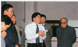
万捷向宋文治等画家介绍图片电分原理

【本刊讯】11月27日，第一届深圳国际水墨画双年展评审团专家、顾问一行二十余人在深圳市文化局副局长、深圳画院院长董小明的陪同下来雅昌公司参观指导。雅昌董事长万捷、总经理何曼玲等公司领导集体出迎，热情欢迎贵宾们的到来。前来公司参观的著名画家有宋文治、周韶华、林壖、刘大为、王玉珏、王晋元、王子武、卢禹舜、卢辅圣、方沉、苗重安、李宝林、钟增亚、戴卫、申少君等。