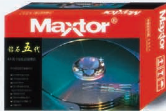
设计: 张伟 许丽君