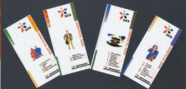
设计: 张伟 / 制作: 谭鹏