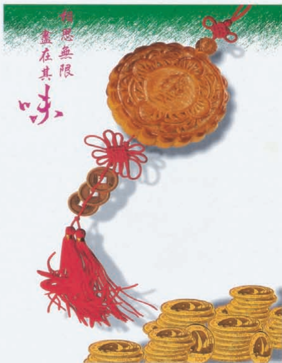
设计：许丽君 王力新

客户之间的沟通更为有效，并为集思广益提供了方便的条件，设计部近来发生的可喜变化有目共睹，而新的业务运作方式的尝试，使设计部内出现了一股小小的“创作冲动”，在近期承接的“紫藤画廊系列”、“蓝德电子系列”、“深圳市商业银行系列”和“小地王酒楼月饼包装系列”等设计任务中，群策群力，拿出了令客户较为满意的方案。其自身的进步促进了对营业的服务质量的提高，并逐步纳入正常的运作轨道。