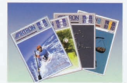
1997年5月《雅昌彩印》（企业内刊）创刊，至今已发行4期。由此拉开了雅昌企业文化建设的序幕。