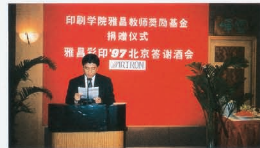
1997年6月2日，雅昌公司在北京王府井大酒店举行“印刷学院雅昌奖励基金捐赠仪式暨雅昌彩印'97北京答谢酒会”。