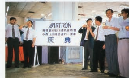
97年6月24日庆祝小森机安全运行一周及海德堡双色机试机成功。

院、中南财经大学和广东工业大学等高等院校吸收了10名优秀应届毕业生，充分体现了万捷董事长“以人为本，重视人才”求贤如渴的人才观。从某种意义上讲，雅昌的成功是这种人才观和人才战略的成功。