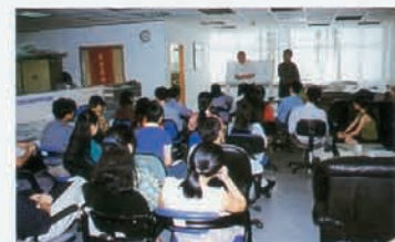
1997年员工培训紧锣密鼓，每次培训现场座无虚席

院、中南财经大学和广东工业大学等高等院校吸收了10名优秀应届毕业生，充分体现了万捷董事长“以人为本，重视人才”求贤如渴的人才观。从某种意义上讲，雅昌的成功是这种人才观和人才战略的成功。