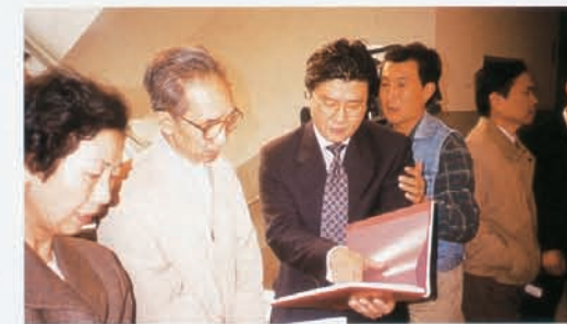
1997年9月15日雅昌公司在北京向中央美术学院捐赠价值约10万元的艺术类图书，在首都美术界传为美谈。