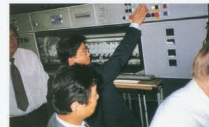
97年9月12日雅昌引进世界最先进的海德堡CD四色印刷机试机成功。