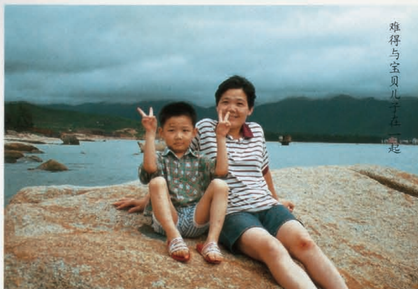
难得与宝贝儿子在一起

雅昌公司承接的全国各大拍卖公司拍卖图录的制作工作每年有两个高峰期：上半年四、五月间大约持续一个半月，下半年九、十月间大约持续两个月，公司上下全力以赴，围绕一个中心，干得热火朝天。这类活件对电分部门的压力特别大，黄部长每天要在车间呆十二小时以上，甚至达十四五个小时，有时午餐和晚餐用餐时间也不休息，一个盒饭就在机器旁搞掂。平时，她几乎每天晚上都要打一个电话到公司向夜班当班主管了解和交代一番工