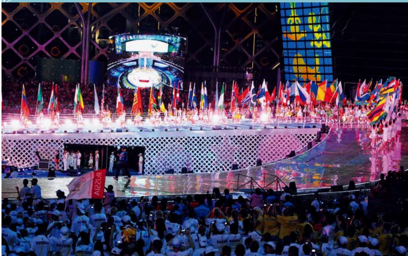
图 1> 大运会开幕现场

2011年8月12日，在美丽旖旎、华光璀璨的深圳湾“春蚕”主场馆，随着国家主席胡锦涛总书记隆重宣布第26届世界大学生夏季运动会盛大开幕，深圳这座年轻的城市焕发出火一般的热情，向全世界展示了一场“不一样的精彩”的青春盛会。