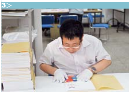
图 2> 赶制深圳大运会餐牌