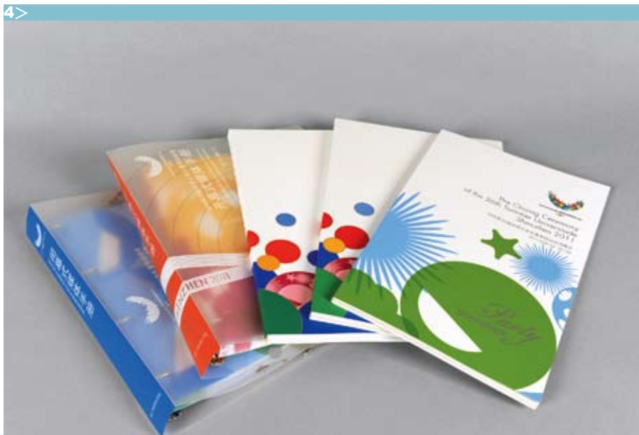
图 4> 雅昌承制的深圳大运会开、闭幕式系列产品

证质量。在大运项目的质量控制方面，雅昌始终坚持质量就是生命的理念，在生产过程中严格控制，层层把关，项目组的每位成员始终都以“在我手中不出错”的雅昌质量基本法严格要求自己，专注产品生产的每一个细节，绝不将存有问题的产品交与客户手中。