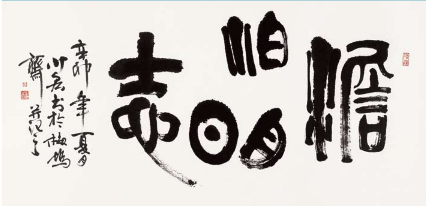
图 76 > 淡泊明志 (2011 年) 书法

但是能看到众多的真迹，能够随时读帖、观画，这使我在潜移默化中拓宽了视野，开阔了眼界，对我的书画学习起到了不小的推动作用，就形成了今天我“眼高手低”的状态——鉴赏水平远远高于自己的动笔的水平！在学习工作中快乐工作，在工作中不断促进自我学习，这就是我特殊的学习方法。